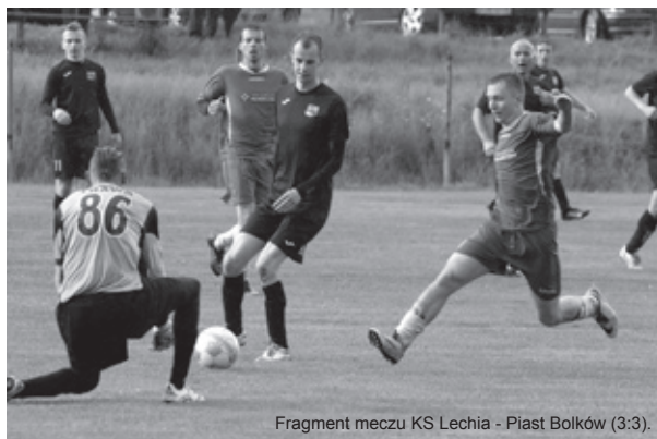
Fragment meczu KS Lechia - Piast Bolków (3:3).

22. kolejka, 15 V: Lechia Piechowice – Piast Bolków 3:3