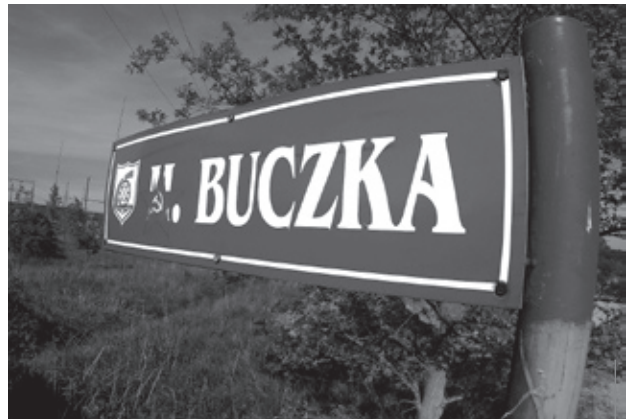
W Piechowicach jest kilka ulic, których nazwy w myśl nowej ustawy, powinny zostać zmienione.

– Niektórzy postulują, żeby wprowadzić nazwy bezpieczne. Chodzi o to, żeby nie pojawili się bohaterowie, którzy za kilkanaście, kilkadziesiąt lat przez kolejne władze mogą zostać uznane za niegodne. W nazewnictwie będziemy kierowali się tym, żeby były to nazwy niepodważalne. Pojawił się wniosek, i ja się do niego przychyliam, żeby przy nazewnictwie uwzględnić położenie ulic. W Piechowicach brakuje np. ulicy Izerskiej, Górzynieckiej. Nie wracałbym natomiast, choć i taka sugestia już padła, do nazw poniemieckich, np. do ulicy