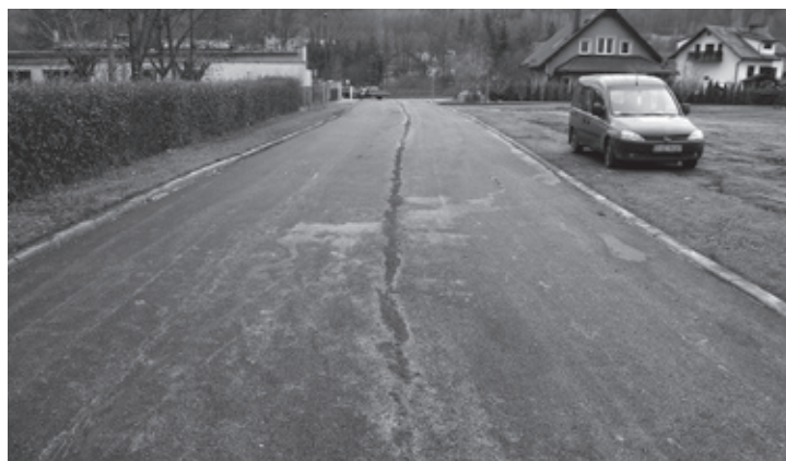
Ul. Orzeszkowej po remoncie.

Przebudowa ulicy Zawadzkiego na przedmiotowych odcinkach powiązana była inwestycją prowadzoną przez KSWiK polegającą na budowie kolektora kanalizacji sanitarnej. Przyczyniło się to do powstania dodatkowych utrudnień i problemów technicznych, które dzięki wysiłkom z obu stron udało się pokonać. Szerzej o inwestycji KSWiK piszemy poniżej. Obecnie trwają prace instalacyjne i drogowe w obrębie pętli autobusowej, które