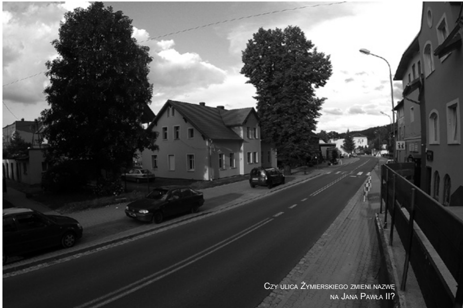
CZY ULICA ŻYMIERSKIEGO ZMIENI NAZWE NA JANA PAWŁA II?

Zapraszamy do podzielenia się z nami swoimi spostrzeżeniami na ten temat. Piszcie: promocja@piechowice.pl