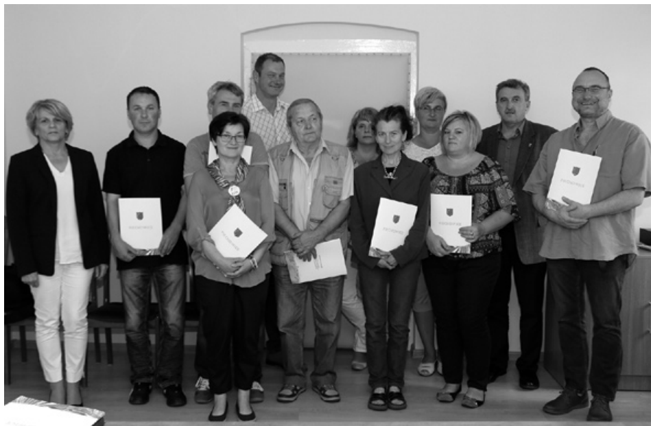
Przedstawiciele rad osiedli na spotkaniu z władzami miasta.

W dniach od 8 do 10 czerwca br. na mocy Zarządzenia Nr 46/2016 Burmistrza Miasta Piechowice z dnia 11 maja 2016 r. zostały zorganizowane wybory do zarządów osiedli.