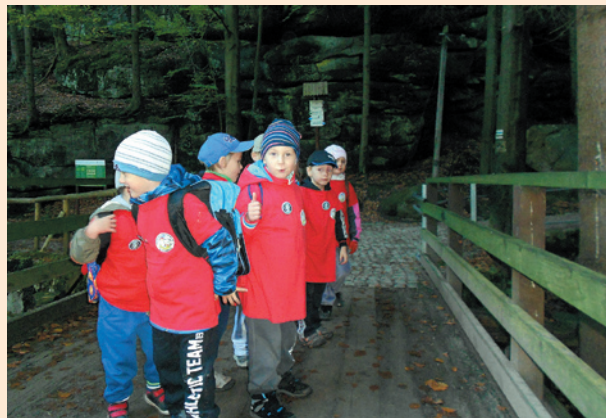
Na trasie Szklarska Poręba Dolna – Chybotek – Wodospad Szklarka szły m.in. dzieci z Przedszkola Samorządowego nr 2 w Piechowicach.