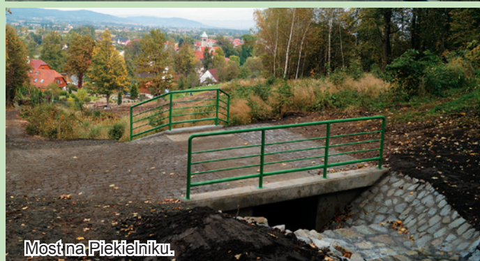
Most na Piekielniku.