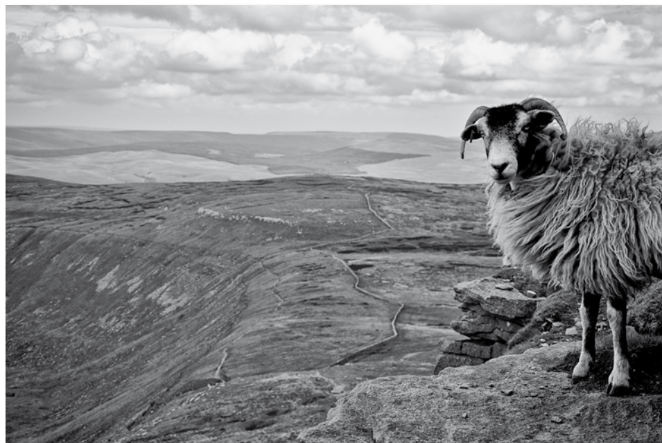
Zwycięskie zdjęcie, Yorkshire Landscape