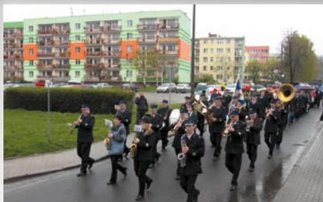
Akademia 3 Maja str. 2