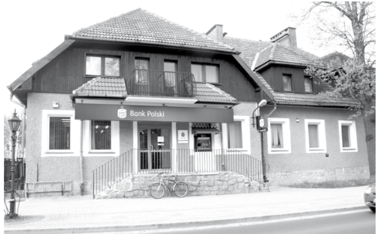
Punkt kasowy na parterze Urzędu wkrótce zostanie zamknięty. Wpłaty będzie można kierować w banku PKO naprzeciwko urzędu.

Umowa Miasta z bankiem PKO BP obowiązuje od 2 maja 2013 roku do 30 kwietnia 2017 roku. To oznacza, że zmieniają się numery kont Urzędu Miasta i wszystkich podległych mu jednostek. Do końca maja mieszkańcy mogą wpłacać pieniądze na dotychczasowe konto, jednak już dziś zostało otwarte nowe konto Urzędu. Z dniem 1 czerwca dotychczasowy rachunek zostanie zamknięty i wszelkich wpłat urzędowych, takich jak: należne podatki i opłaty lokalne, w tym między innymi podatek od nieruchomości, rolny,