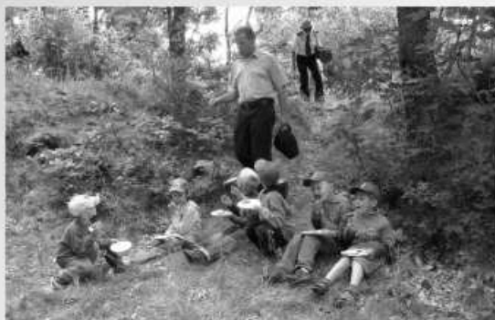
Najmłodsze „Kangurki” rozpoczęły pierwsze dni w przedszkolu od spacerów i zabaw taneczno-muzycznych.