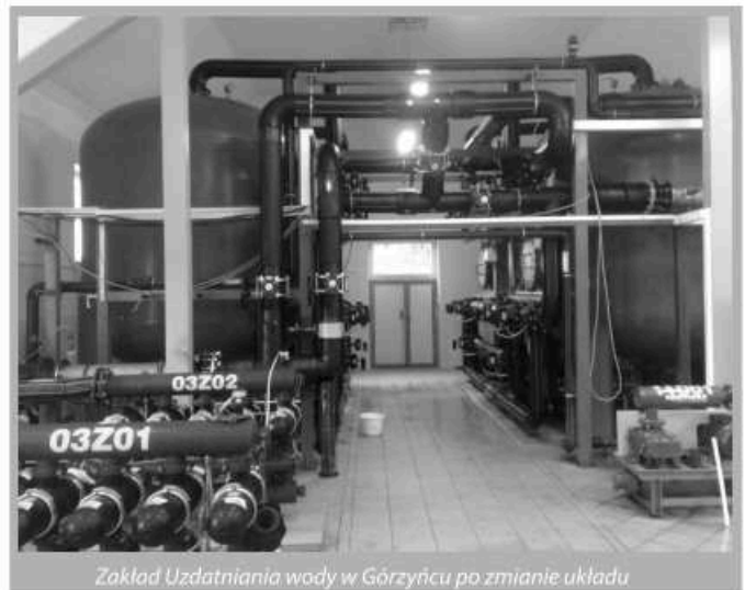
Zakład Uzdantniania wody w Górzeńcu po zmianie układu