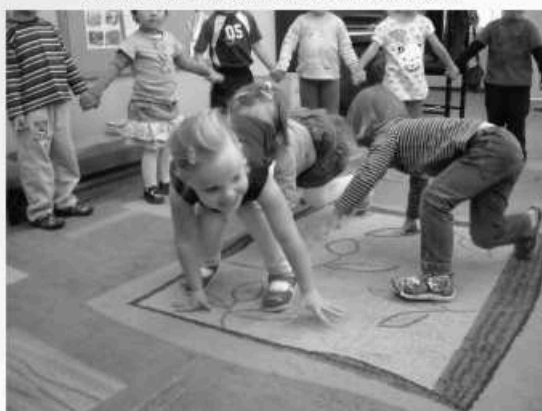
Grupa „Tygryski” na zajęciach rytmiczno-muzycznych wesoło się bawiła.

Przedszkole Samorządowe nr 1 „Chatka Puchatka” serdecznie Wita Wszystkie Dzieci i Rodziców w nowym roku szkolnym 2011/12