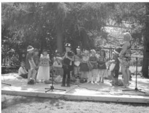
Grupa „ Mądre Sowy” zaprezentowała zdolności aktorskie na Dożynkach Parafialnych w przedstawieniu „ Sen Jasia”