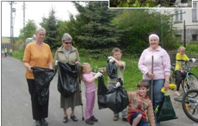
Mieszkańcy chętnie brali udział w sprzątaniu