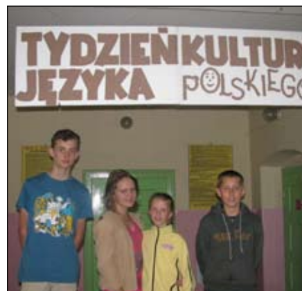
Wielu uczniów lubi język polski