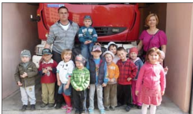
Dzieciom bardzo podobała się wizyta u strażaków

4 maja z okazji Dnia Strażaka nie mogło zabraknąć przedszkolaków w Piechowickiej Ochotniczej Straży Pożarnej. Dzieci wręczyły strażakom laurki, kwiatki oraz wykonane przez siebie prace plastyczne przedstawiające pracę strażaków.