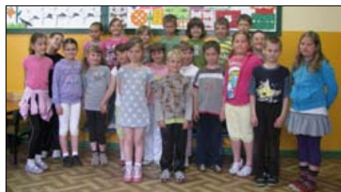
W podstawówce teraz uczy się czwórka sześciolatków