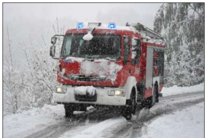
W czasie akcji w Michałowicach strażacy przetestowali nowy wóz bojowy