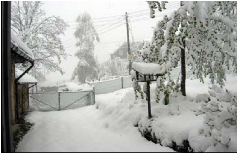
Michałowice zostały zasypane śniegiem w ciągu kilku godzin.

W wielu michałowickich domach na początku maja dzieci siedziały w kurtkach, a spały w swetrach i pod dwoma kołdrami.