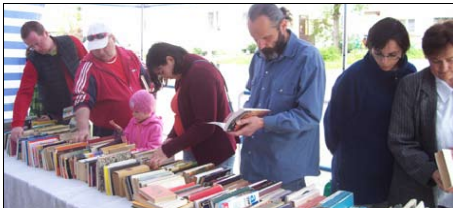
Na kiermaszu można było znaleźć ciekawe książki