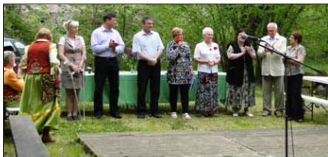
Piknik utwierdził uczestników w przekonaniu, że warto organizować takie integracyjne międzypokoleniowe spotkania.