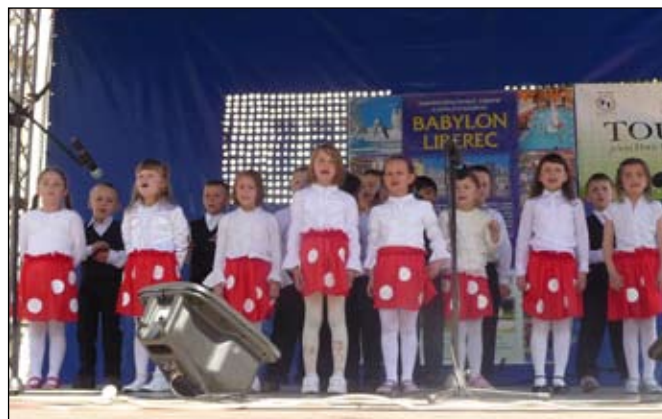
Przedszkolaki wystąpiły na scenie na targach Tourtec w Jeleniej Górze

Starostwu jeleniogórskiemu dziękujemy za zaproszenie, a także za upominki, które otrzymały wszystkie dzieci.