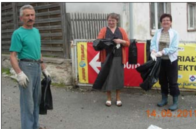
Początek akcji – rozdanie worków