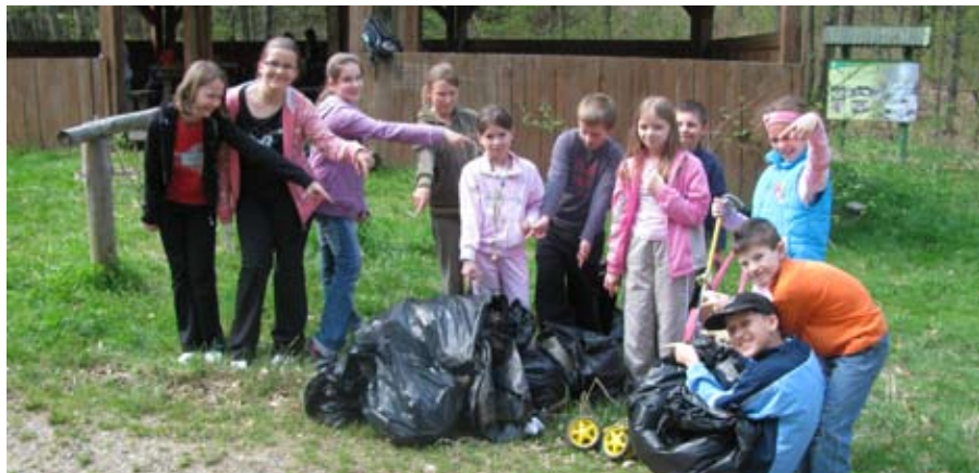
Uczniowie z podstawówki w czasie akcji zebrali sporo śmieci

Uczniowie naszej szkoły uważają, że dobrym pomysłem jest sprzątanie Piechowic chociaż dwa razy do roku i chcieliby, aby razem z nimi sprząтали także dorośli.