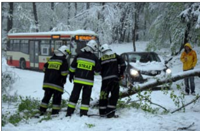
3 maja przez kilka godzin nieprzejezdna była Droga Sudecka do Michałowic oraz krajowa "3". W Piechowicach odnotowano 15 zdarzeń związanych z atakiem zimy. Strażacy usuwali połamane konary i drzewa, fot. Dariusz Uzorko

Spółka zapewnia, że po uzyskaniu wszystkich koniecznych uzgodnień i pozwoleń przystąpi do przebudowy linii. Mieszkańcy jednak nie uwierzą, dopóki prace w terenie się nie zaczną.