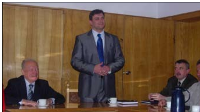
Spotkanie w starostwie jeleniogórskim jest szansą na wyprowadzenie ciężarówek z ulicy Pakoszowskiej

W trakcie spotkania poproszono również m.in. o oznakowanie trzech mostków, które znajdują się na ulicy Pakoszowskiej. Dziś nie wiadomo kto ma tam pierwszeństwo przejazdu. Nie ma też informacji, że droga się zwęża. Po tym spotkaniu, 26 kwietnia odbyła się wizja lokalna na ulicy Pakoszow-