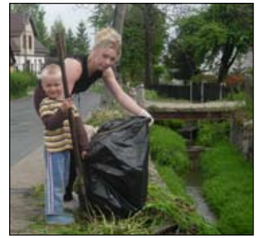
Sprzątanie może być nauką również dla najmłodszych