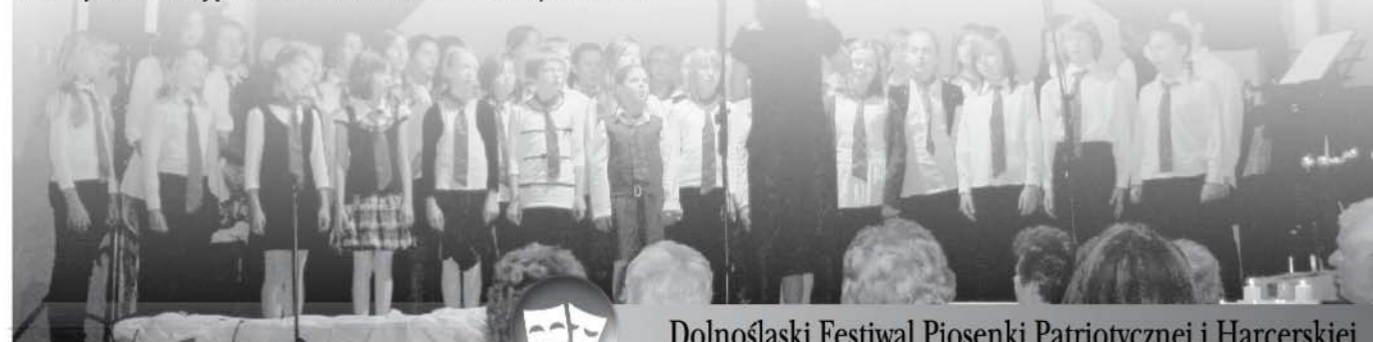
Dolnośląski Festiwal Piosenki Patriotycznej i Harcerskiej