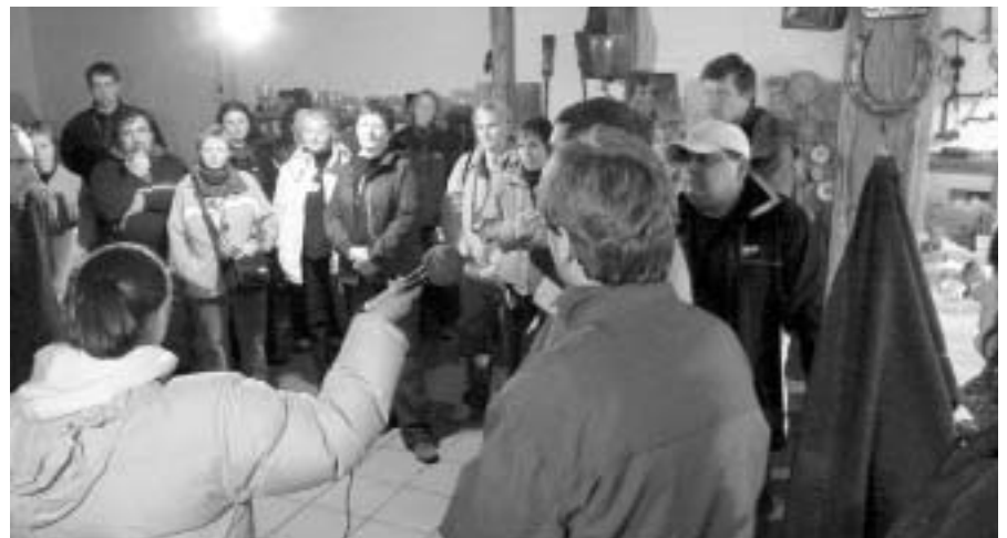
Czesi chcieli zobaczyć co można polecić do zwiedzenia w regionie.