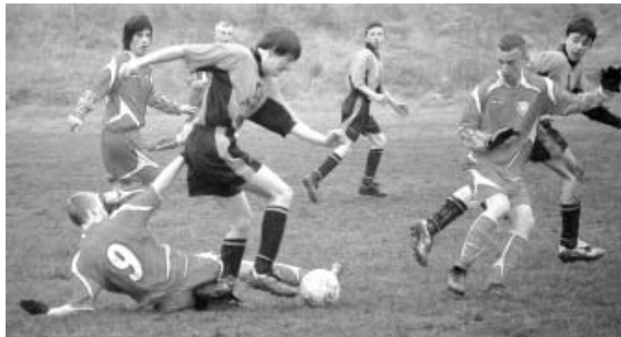
Lechia Piechowice konsekwentnie wraca do czasów świetności

29 kwietnia odbędzie się sesja absolutoryjna, na której radni będą głosować m.in. w sprawie udzielenia absolutorium burmistrzowi z wykonania budżetu za 2007 rok.