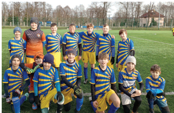
Pierwsza drużyna młodzików bardzo udanie prezentowała się w IV lidze, zajmując 2. miejsce.

Dzieci i młodzież zrzeszone w klubie w drugiej połowie lipca wy-