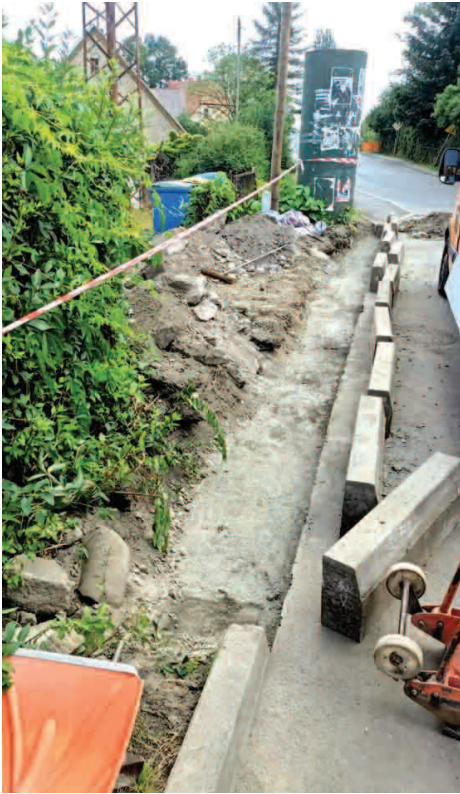
Podnoszenie krawężników przy ul. Wiejskiej

Sporo drobnych, ale niezwykle ważnych prac, służących poprawie estetyki miasta, wykonali w ostatnim czasie pracownicy Zakładu Usług Komunalnych w Piechowicach.