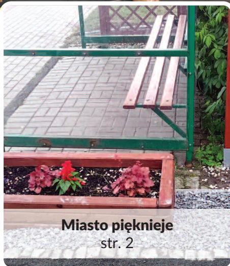
Miasto pięknie str. 2