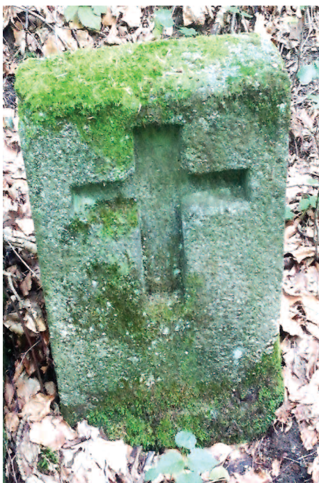
Obecne zdjęcie krzyża

Krzyże miały różne formy, najczęściej greckie, łacińskie, maltańskie, barokowe. Budowano też przydrożne kapliczki z umieszczoną figurką, krzyżem czy ołtarzykiem – możliwe, że z poczucia ogromnej winy. Materiał użyty do wykonania krzyża zazwyczaj pochodził z miejscowego surowca, jak bazalt, piaskowiec, granit. W przypadku naszego Piechowickiego krzyża jest to granit. Na krzyżach od XIV wieku zaczęto rytować w kamieniu proste wizerunki narzędzi zbrodni, jak pistolet, kusza, łuk, nóż, włócznia, topór, siekiera, miecz i inne. W pobliskiej Czernicy jest krzyż z dobrze za-