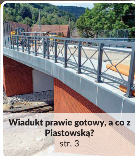
Wiadukt prawie gotowy, a co z Piaśtowską? str. 3