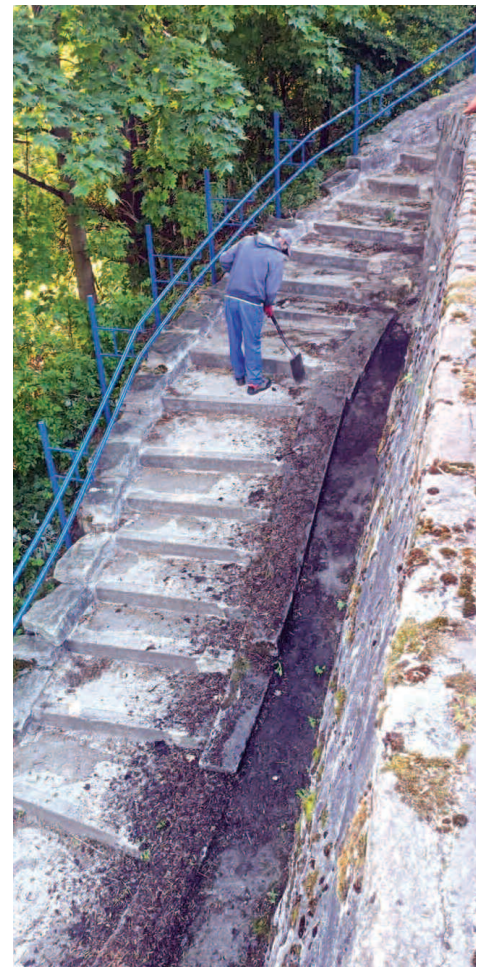
Oczyszczone zejście z ul. Nadrzecznej