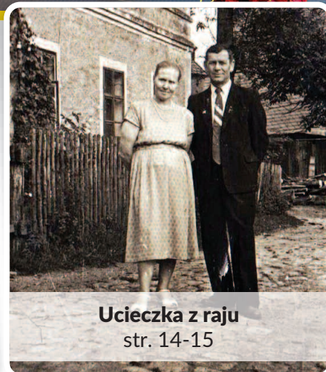
Ucieczka z raju str. 14-15