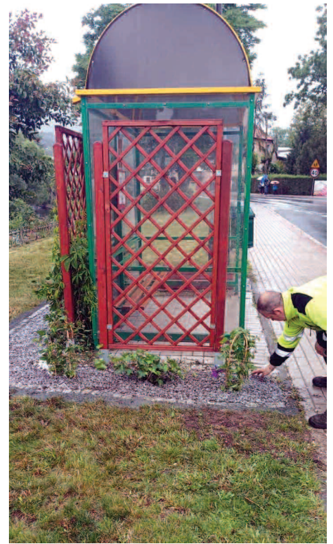
Nowe nasadzenia przy przystankach

W lipcu, tuż przed zamknięciem numeru odnowiono miejskie tablice ogłoszeniowe. To tylko część prac, prezentujemy je na zdjęciach. Jak zmienia się nasze otoczenie, można śledzić na facebookowym profilu ZUK-u.