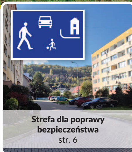
Strefa dla poprawy bezpieczeństwa str. 6