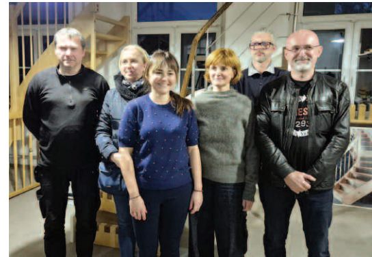
Osiedle Gorzyniec zarząd