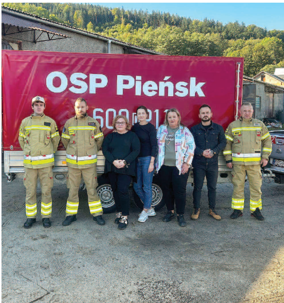
Pomoc rzeczowa otrzymana od strażaków OSP z Pieńska.

spokoić podstawowe potrzeby poszkodowanych.