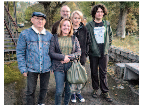
Osiedle Michałowice zarząd

Najważniejszym zadaniem na dzisiaj jest przypilnowanie tematu dawnego ośrodka Potok. Zdaję sobie sprawę, że nie powstrzymamy właściciela przed budową, ale musimy przypilnować, aby wybudował to, na co pozwala mu prawo i żeby budynki, które postawi, nie przekraczały norm wysokościowych. Podejmę też wiele działań na rzecz poprawy bezpieczeństwa na drogach.