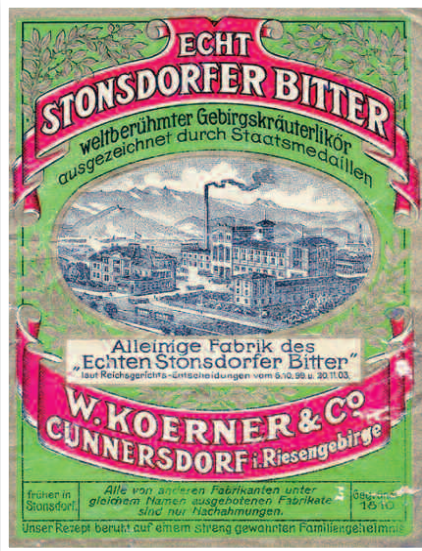
Etykieta likieru z widokiem fabryki