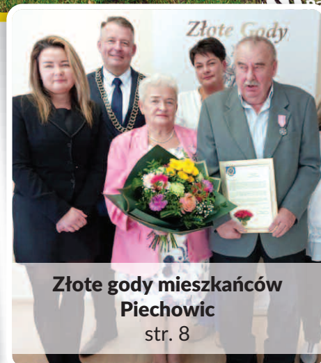
Złote gody mieszkańców Piechowic str. 8