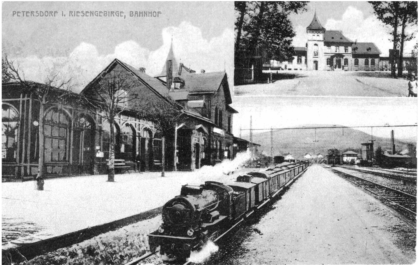
Widokówka z 1918 z celowo pomniejszonym pociągiem, widoczna wieża ciśnienia w rogu dworzec od miasta

W maju 1888 roku ogłoszono ustawę o budowie odcinka Hirschberg – Petersdorf z przyznanym sumą 1,05 mln marek na jej realizację. Budowa pierwszego odcinka z Jeleniej Góry do Cieplic rozpoczęła się dopiero w 1889 r. ze względu na spory co do przebiegu trasy, a otwarta 1 sierpnia 1891.