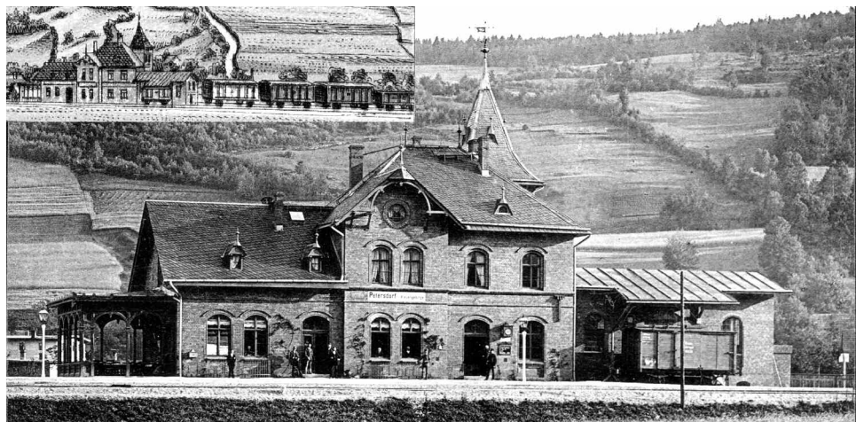
Najstarsze zdjęcie dworca z 1892 r. w rogu w litografii z 1896 r.

Realizacji podjęto się w większości państwo w imię rozwoju gospodarczego regionu co przyczyniło się do wykupu akcji od różnych