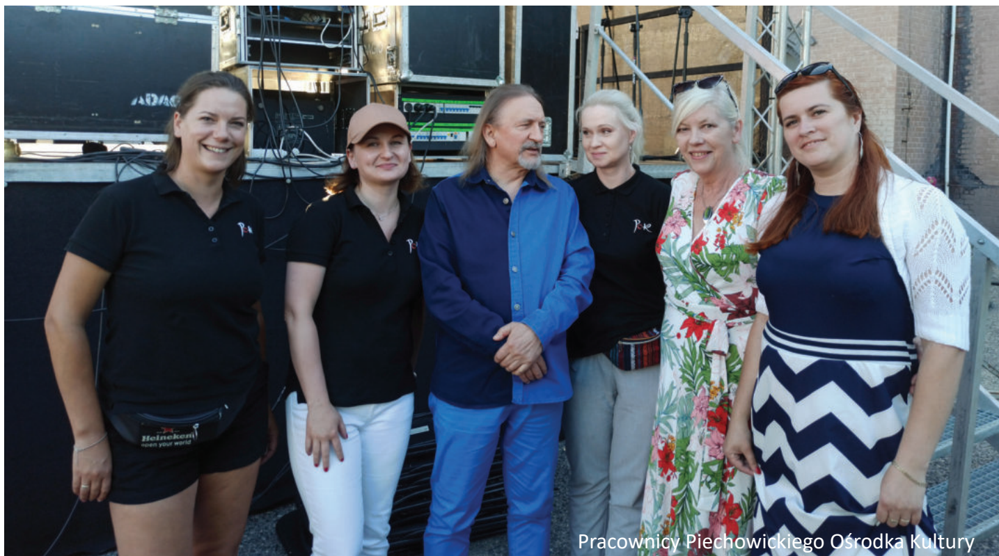
Pracownicy Piechowickiego Ośrodka Kultury

Dziękujemy za lata wspólnej pracy oraz za to, że zawsze mogliśmy liczyć na pomoc i wsparcie z Pani strony.