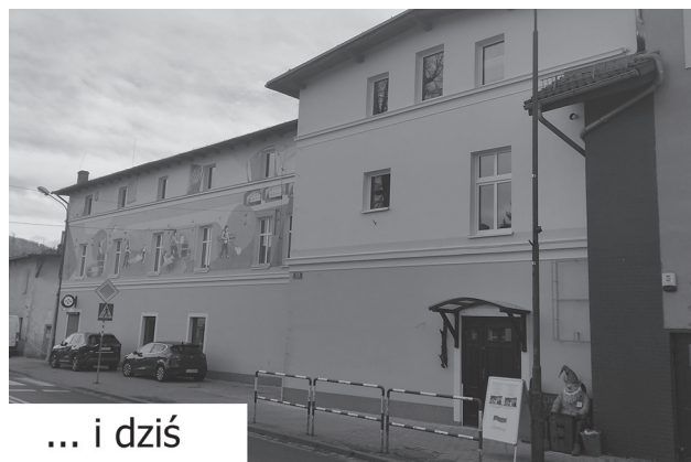
... i dziś