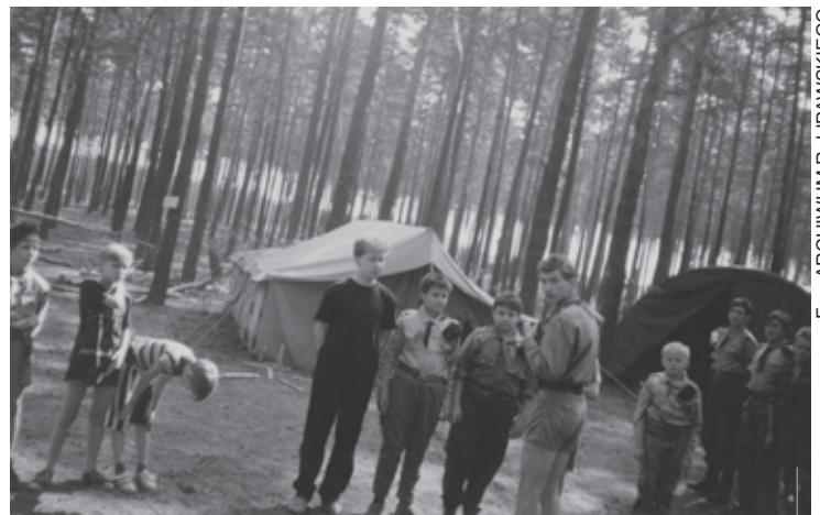
Lata 90-te były trudne dla harcersztwa i wielu organizacji pozarządowych. Obóz 5 PDH w Wąchabnie w 1994r.