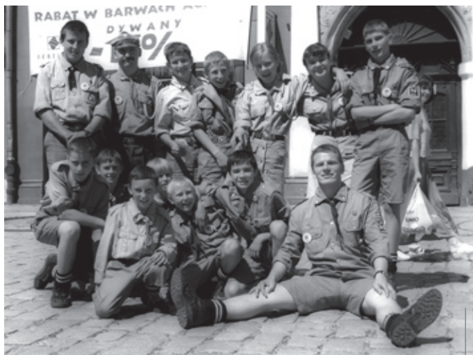
Najdłuższej działającą drużyną w mieście jest 8 PDH „Burza” (zdjęcie z 2000 r.)