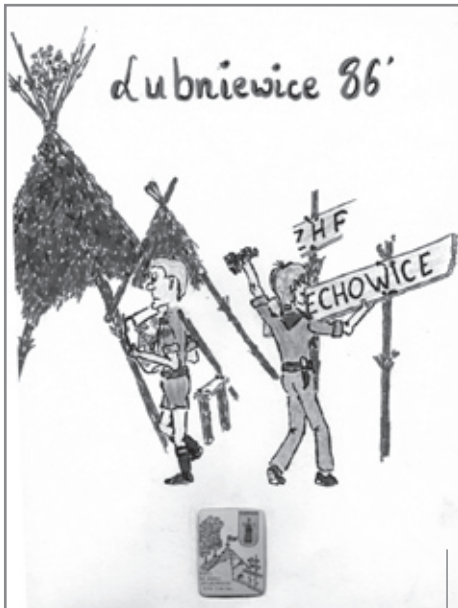
Kronika obozu w Lubniewicach w 1986 roku.