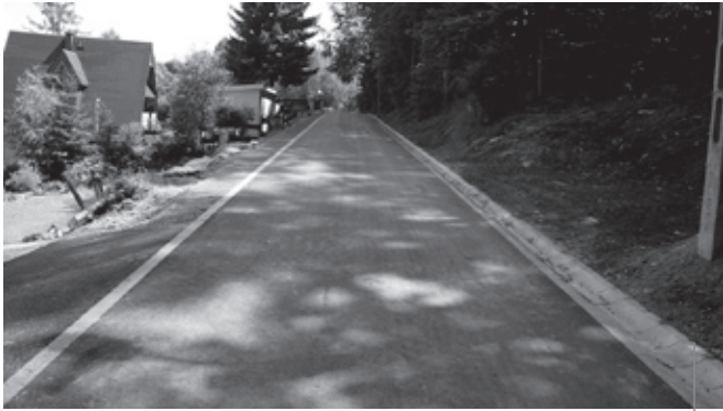
Ulica Kolonijna zostanie podzielona na kilka mniejszych.

Wprowadzenie nazw ulic i numeracji porządkowej budynków to konieczność, do tego zobowiązuje nas rozporządzenie ministra administracji i cyfryzacji oraz prawo geodezyjne i kartograficzne.