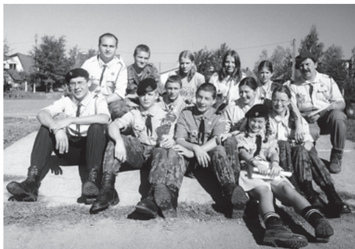
12 PDH „Zenit” podczas Startu Harcerskiego w Piechowicach w 2003r.