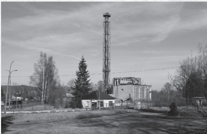
Pozostałości po zakładzie - 2016 rok. Widoczny na zdjęciu komin został wyburzony w marcu tego roku.

chowic przyjechał w 1946 roku. Od 1957 roku pracował w Karelmie (później przez wiele lat był szefem działu kontroli jakości). – To było w listopadzie 1948 roku – przypomina sobie. Chodził wtedy do szkoły podstawowej (przy