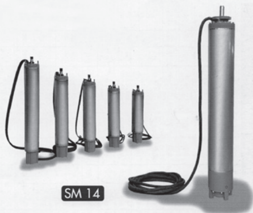
Zmodernizowana wersja silników do pomp głębinowych z katalogu z lat 90-tych.

spełna 350 osób. Wówczas zakład przekształcono w spółkę akcyjną. Część akcji otrzymali pracownicy, a większość – fundusz inwestycyjny, zarządzany przez konsorcjum Fidea Menagement. W nim najwięcej do powiedzenia miał francuski bank „Arjil”. I związanie się z NFI, zdaniem wielu pracowników, było błędem, który pogrzyżył zakład.