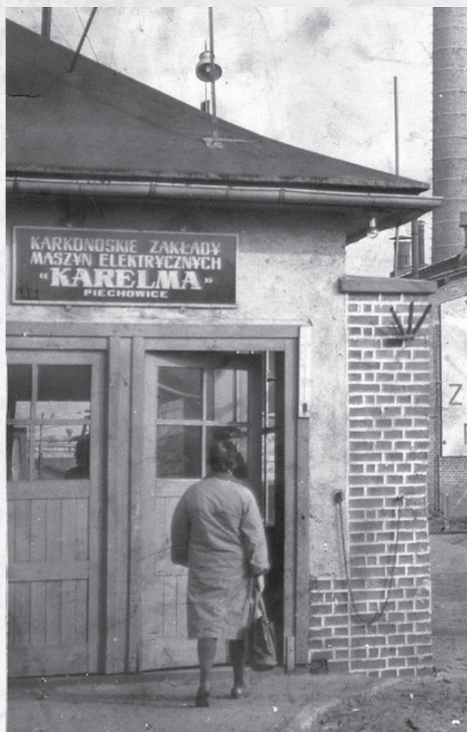
Wejście do Karelmy. 1970 rok.

Karelma, jak i wiele państwowych gigantów, dotkliwie odczuła transformację ustrojową. Rynek zbyt załamał się, znacznie ograniczona została produkcja dla wojska. W zakładzie przeprowadzono restrukturyzację zatrudnienia. Jeszcze w 1996 roku, jak dowiadujemy się z innego artykułu w „Nowinach Jeleniogórskich” zatrudniał nie-