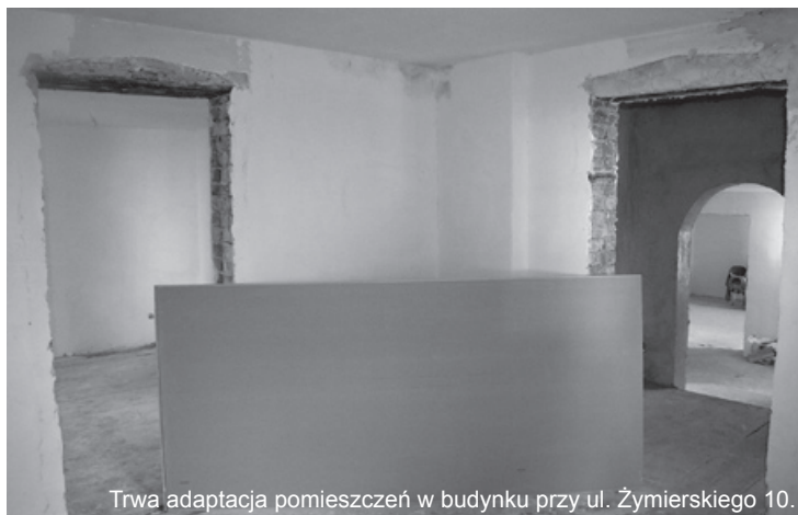
Trwa adaptacja pomieszczeń w budynku przy ul. Żymierskiego 10.