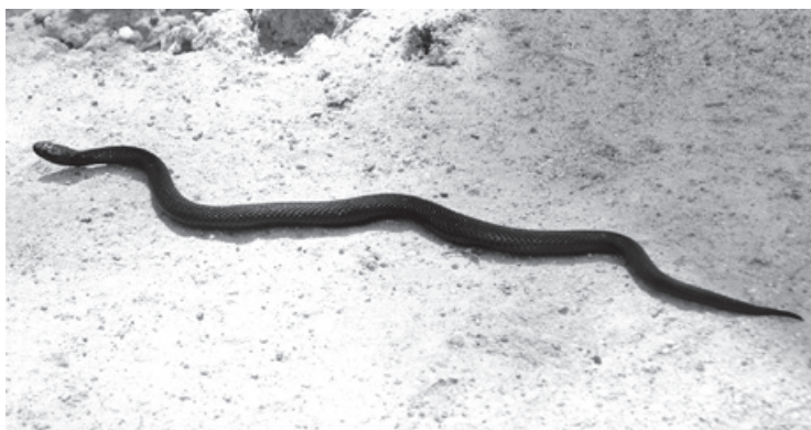
W Piechowicach występuje żmija zygzakowata. Na zdjęciu - odmiana czarna.

• Park przypałacowy w Pakoszowie (1,96 ha). Teren ogrodzony starym, kamiennym murem, wzdłuż którego rośnie obrzeżnie pas zaniedbanej zieleni wysokiej. Wśród drzew zwracają uwagę okazałych rozmiarów dęby ( Quercus sp. ), lipy ( Tilia sp. ), klony ( Acer sp. ), jesion wyniosły ( Fraxinus excelsior ), 370 cm i jawory ( Acer pseudoplatanus ), chociaż na terenie posesji jest ich niewiele. Najciekawszym obiektem dendrologicznym jest tu jednak stara aleja lipowa wzdłuż drogi prowadzącej do pałacu od strony ulicy Pakoszowskiej. Stare, dziuplaste lipy (26 drzew)