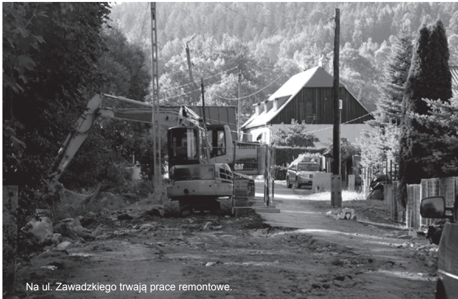
Na ul. Zawadzkiego trwają prace remontowe.

W nawiązaniu do informacji związanych z planowanymi w bieżącym roku inwestycjami na terenie Gminy Piechowice, podanych w lipcowym numerze Informatora Piechowickiego, postanowiłem je uzupełnić i poszerzyć z uwagi na duże zainteresowanie tym tematem naszych Czytelników.