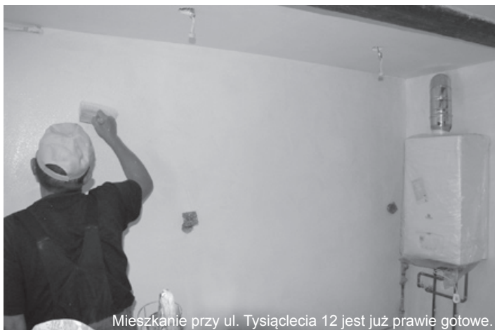
Mieszkanie przy ul. Tysiąclecia 12 jest już prawie gotowe.