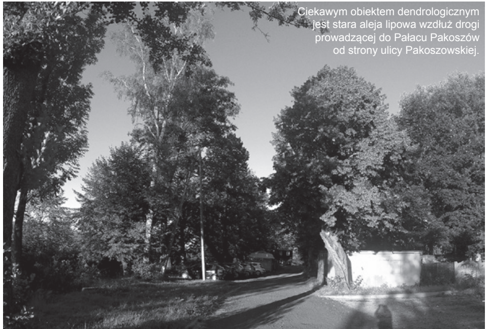
Ciekawym obiektem dendrologicznym jest stara aleja lipowa wzdłuż drogi prowadzącej do Pałacu Pakoszków od strony ulicy Pakoszewskiej.

W przypadku ssaków szczególnie istotne wydawało się wykazanie nietoperzy występujących na terenie Piechowic, ze względu na to, iż wszyscy krajowi przedstawiciele tego rzędu są objęci w Polsce ochroną prawną. Stosunkowo wysokie położenie i ostry klimat nie sprzyja występowaniu nietoperzy, jednak sztolnie w Cichej Dolinie doskonale nadają się na stanowiska zimowe. Z uwagi na ochronę nietoperzy zostały częściowo zamurwane i zabezpieczone kratami. Na obszarze miasta występuje 12 gatunków tych latających