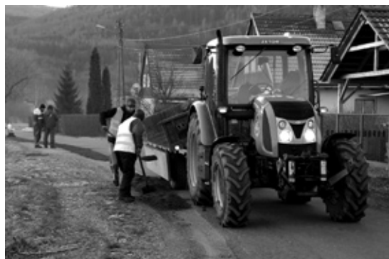
W grudniu rozpoczęły się prace przy naprawie pobocza ul. Polnej. Wkrótce będą kontynuowane.