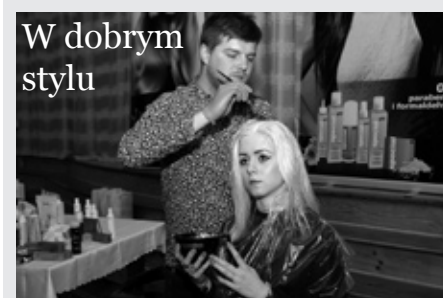
W dobrym stylu

Wykaz jest dostępny do wglądu w godzinach pracy Urzędu.