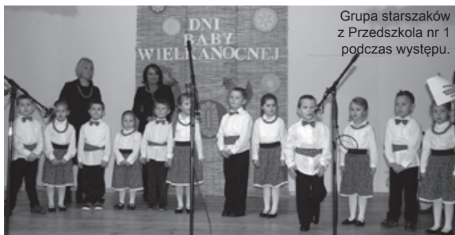
Grupa starszaków z Przedszkola nr 1 podczas występu.

Tegoroczne piechowickie święto sztuki ludowej związanej z tradycją Świąt Wielkanocnych pozytywnie zaskoczyło gości wprowadzonymi nowościami. W dniach 19-20 marca br. na estradzie Piechowickiego Ośrodka Kultury wystąpiło 15 grup śpiewających i zespołów folklorystycznych z naszego regionu. Na zakończenie swojego