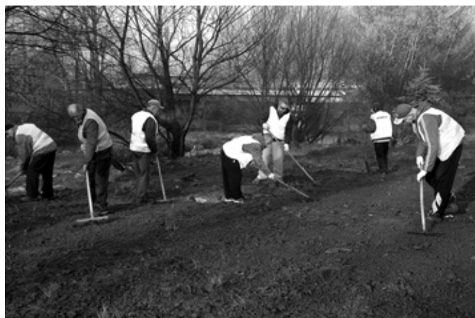
Prace ziemne przy ul. Zamkowej.

Pałacu Pakoszów planowane jest sprzątnięcie dalszego odcinka drogi przy rzece Kamiennej, aż do granicy gminy.