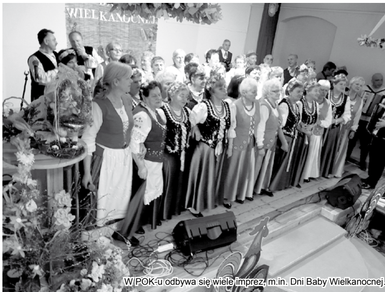
W POK-u odbywa się wiele imprez, m.in. Dni Baby Wielkanocnej.

w okresie wrzesień – czerwiec, każda środa od godz. 16.00,