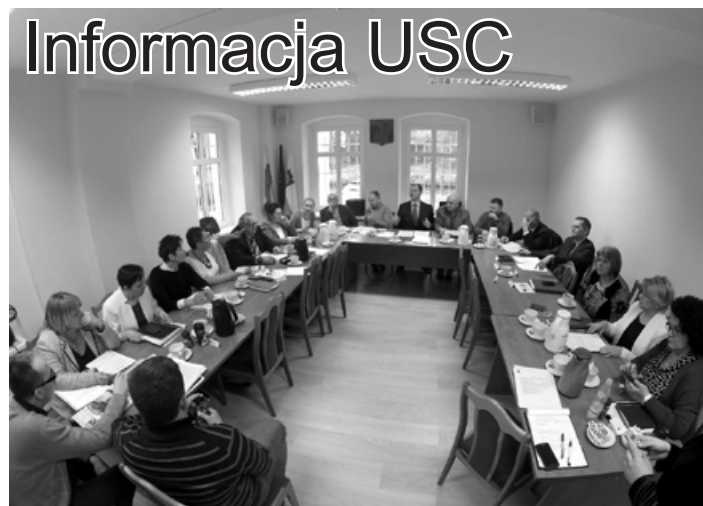
Na wyremontowanej sali konferencyjnej odbywają się sesje Rady Miasta, ale pełni też ona funkcję sali ślubów.

Dnia 1 marca 2015 roku weszła w życie ustawa z dnia 28 listopada 2014 roku „Prawo o aktach stanu cywilnego”. 1 marca ruszył także System Rejestrów Państwowych (SRP). Nowy system informatyczny połączył kluczowe z punktu widzenia funkcjonowania państwa rejestry. W zintegrowanym systemie znajdują się m.in. rejestry PESEL, dowodów osobistych i aktów stanu cywilnego.