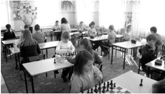
Finałowy Turniej Szachowy w szkole w Stankowicach.