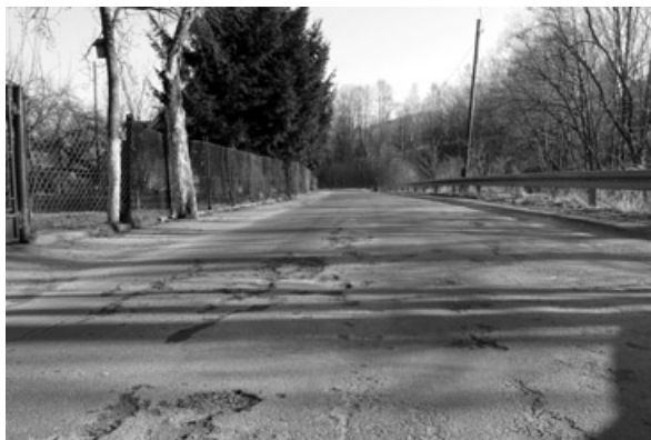
Z pozyskanych pieniędzy zostanie m.in. wyremontowana ulica Zawadzkiego.

Z protokołu strat w infrastrukturze Gminy Piechowice spowodowanych przez intensywne opady deszczu w 2014 roku, który został zweryfikowany przez Komisję Wojewódzką powołaną przez Wojewodę Dolnośląskiego, zostały przyjęte do realizacji następujące zadania: