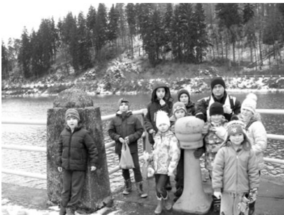
Jezioro Złotnickie - grupa na zaporze wodnej.