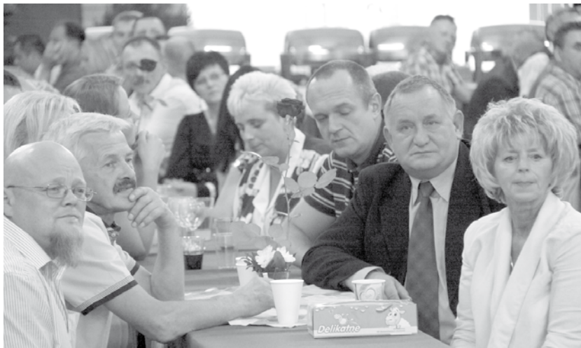
We wrześniu w zakładzie obchodzono Dzień Papiernika.