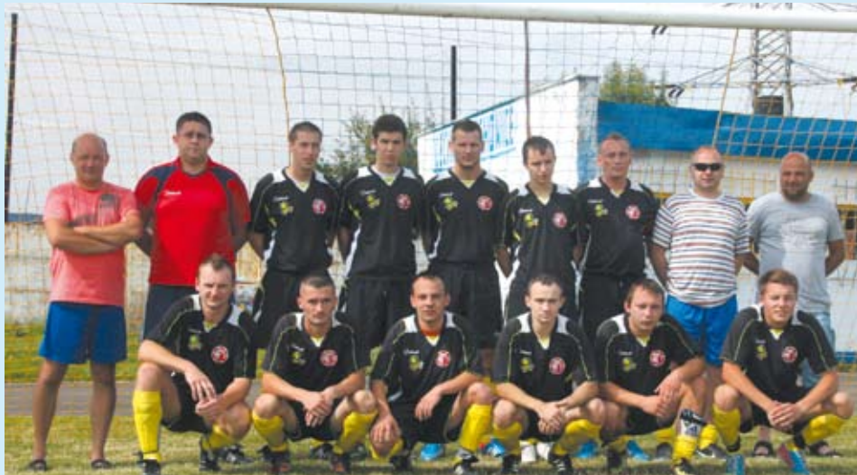
Powyżej - seniorzy, poniżej - młodzicy Lechii Piechowice.