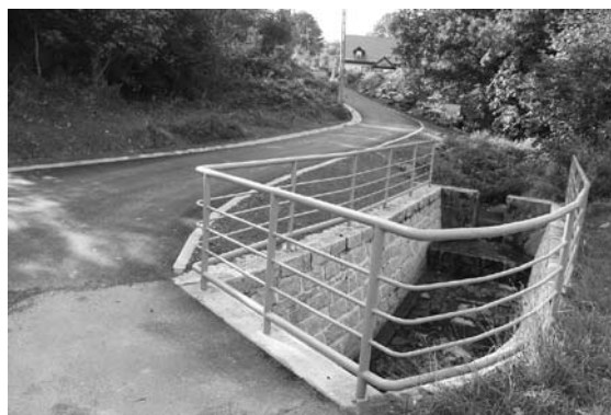
Ulice Stroma (powyżej) i Zamkowa (poniżej) zostały wyremontowane.