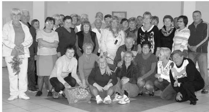
„Oświadczam, że byłem/byłam na Święcie Pieczonego Ziemniaka i bardzo dobrze się bawiłem/bawiłam” pod tymi słowami złożyli podpisy wszyscy widoczni na zdjęciu uczestnicy tej niezwykle udanej imprezy.