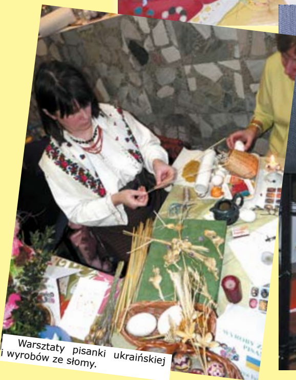
Warsztaty pisanki ukraińskiej i wyrobów ze słomy.