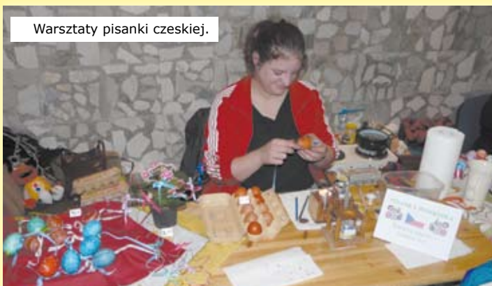
Warsztaty pisanki czeskiej.