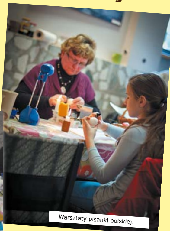
Warsztaty pisanki polskiej.