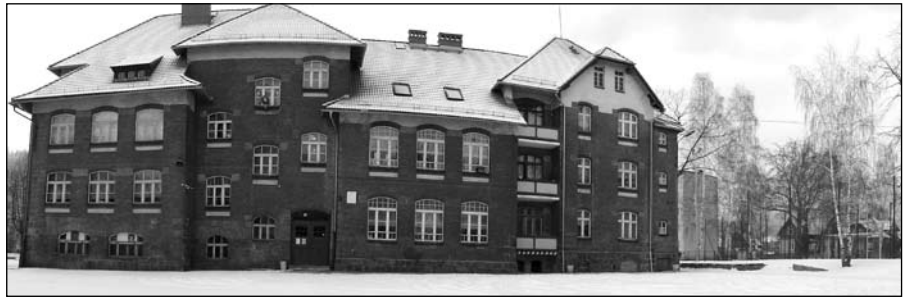
Najdroższe w każdej gminie jest utrzymanie oświaty: szkół i przedszkoli

Na finansowanie zadań współfinansowanych przez Unię Europejską gmina weźmie 2,6 mln zł kredytów (później większość zostanie zwrócona przez UE).