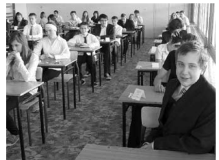
Próbny egzamin nie sprawił uczniom kłopotów

Nie po raz pierwszy trzecioklasiści mogą sprawdzić swoje umiejętności. Piechowickie gimnazjum już od kilku lat korzysta z możliwości otrzymania darmowych zestawów egzaminacyjnych dla swoich uczniów. Między innymi bierze udział w bezpłatnym próbnym egzaminie organizowanym przez wydawnictwo Operon. Rodzice uczniów oraz szkoła nie ponoszą żadnych kosztów związanych z wydrukowaniem 150 zestawów egzaminacyjnych. W tym roku szkolnym próbnym egzaminem wydawnictwo Operon przeprowadziło w grudniu. Poza próbnymi egzaminami trzecioklasiści co najmniej raz w miesiącu piszą wewnętrzne testy. Takie działania szkoły zmierzają do sprawdzenia opanowania wiadomości i umiejętności określonych