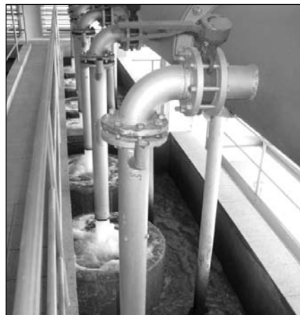
Ustalając stawki dopłat samorząd zadba o piechowickich przedsiębiorców

Zgodnie z procedurą prawną uchwała o odmowie zatwierdzenia taryf ( uchwała nr 17/V/2011 Rady Miasta Piechowice z dnia 03 lutego 2011 r. w sprawie odmowy zatwierdzenia taryf dla zbiorowego zaopatrzenia w wodę i zbiorowego odprowadzania ścieków na terenie Gminy Miejskiej Piechowice przedłożonych przez Karkonoski System Wodociągów i Kanalizacji Sp. z o.o. w Bukowcu ) została przekazana Wojewodzie Dolnośląskiemu, który sprawuje w tym zakresie nadzór nad działalnością gminy.