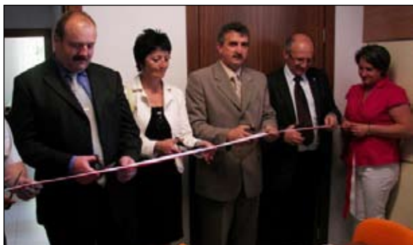
Dzięki otwarciu właśnie centrum będzie bezpieczniej

W ramach projektu unijnego „Tworzenie zintegrowanych polsko-czeskich struktur współpracy w zakresie zapobiegania i usuwania skutków klęsk żywiołowych w pasie transgranicznym” w Piechowicach uruchomione zostało Transgraniczne Centrum Ewakuacji i Pomocy Ludności.