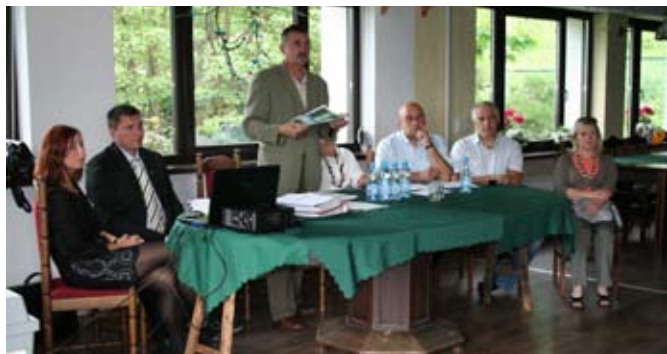
Zebrania prowadzili przewodniczący rady i burmistrz

Wybory do Rad Osiedli: Górzyniec, Piastów i Michałowice odbyły się kolejno 8, 9 i 10 czerwca 2011 r. Niestety ze względu na niską frekwencję mieszkańców i brak quorum nie udało się przeprowadzić wyborów w żadnym z osiedli.