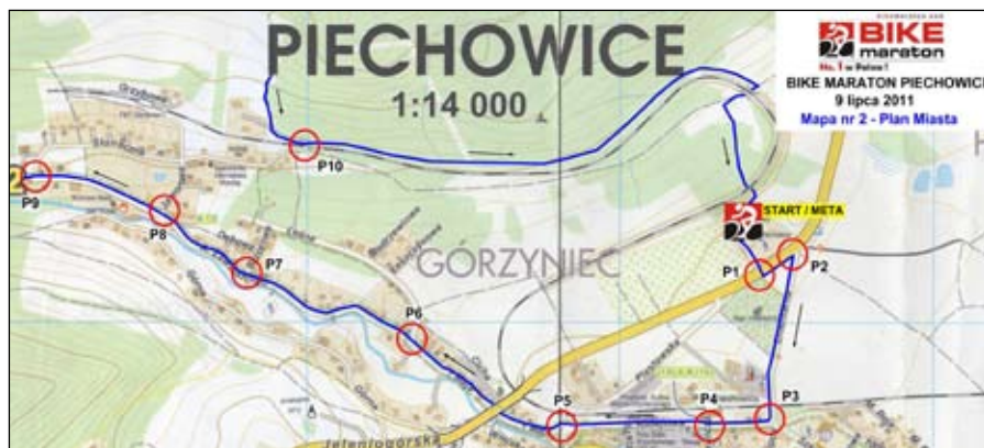
Trasa przejazdu kolarzy przez Piechowice z najlepszymi miejscami do kibicowania

W wyścigach Bike Maraton biorą udział nie tylko zawodnicy, ale również zupełni amatorzy, zarówno 10-latkowie jak i zawodnicy 60-letni. Mężczyźni i kobiety, chłopcy i dziewczęta. To zawody dla każdego.