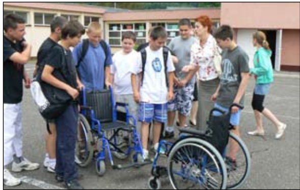
Młodzież przekonała się o kłopotach osób niepełnosprawnych

W trakcie zajęć, które odbyły się 8 czerwca, uczniowie mieli możliwość wejścia w rolę osoby niepełnosprawnej poprzez próbę jazdy na wózkach inwalidzkich, chodzenie z pomocą kul oraz tzw. „spacer ślepego” – osoba z zawiązanymi oczami była prowadzona przez drugiego ucznia. Kolejnym elementem warsztatów było spojrzenie na miejsce zamieszkania oczami osób niepełnosprawnych. 10 czerwca gimnazjaliści wyszli na ulice Piechowic. Uczniowie siedząc na wózkach inwalidzkich pokonywali bariery architektoniczne. Przekonali się, jak ciężko jest poru-