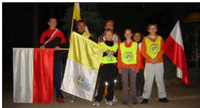
Piechowicka sztafeta Kwietnego Biegu