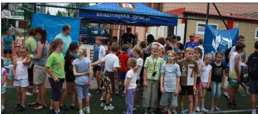
Uczestnicy Parafiady dobrze się bawili

Na zakończenie „Parafiady” odbyła się uroczysta dekoracja zwycięzców medalami i pucharami. Fundatorami nagród byli: