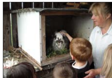
Dzieci odwiedziły eko-gospodarstwo

nie spędzony czas i wspianiałym rodzicom za pomoc i zaangażowanie w pracę przedszkola. Do zobaczenia po wakacjach.