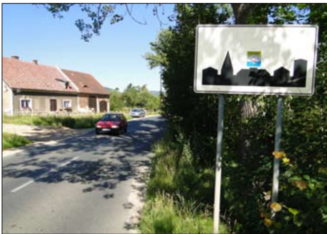
Remont rozpocznie się przy skrzyżowaniu z ul. 1 Maja...