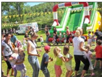
Kubusiowe zabawy dzieci

„Kubusiowe zabawy” to cykliczna impreza od kilku lat finansowana ze środków Rady Rodziców oraz z pozyskanych funduszy. Gościmy w tym czasie przyszłych przedszkolaków z rodzicami oraz obdarowujemy ich prezentami. Również i tym razem dzieci podczas konkursów mogły popisać się swoimi umiejętnościami i sprawnością. Bawiły się na zamku dmuchanym, zjeżdżałni oraz mogły, dzięki zaangażowaniu Stowarzyszenia Piechowice, popróbować gry w szachy. Nie zabrakło również słodkości do przekąszenia. Dzięki-