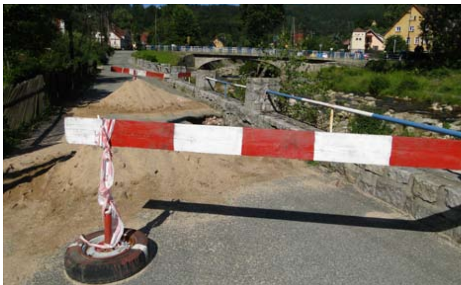
Dziura w ulicy Nadrzecznej wkrótce zniknie