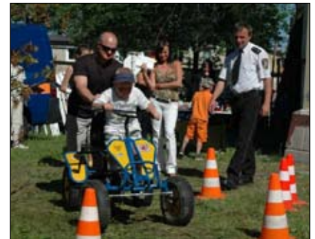
Dzieci chętnie jeździły na gokartach