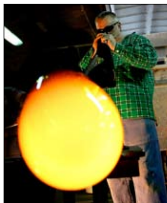
Szklarskie tradycje Piechowic z powodzeniem propaguje na świecie Huta Julia