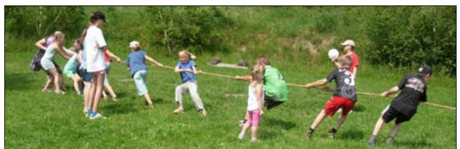
Dzieci miło spędziły czas dzięki organizatorom imprezy i sponsorom