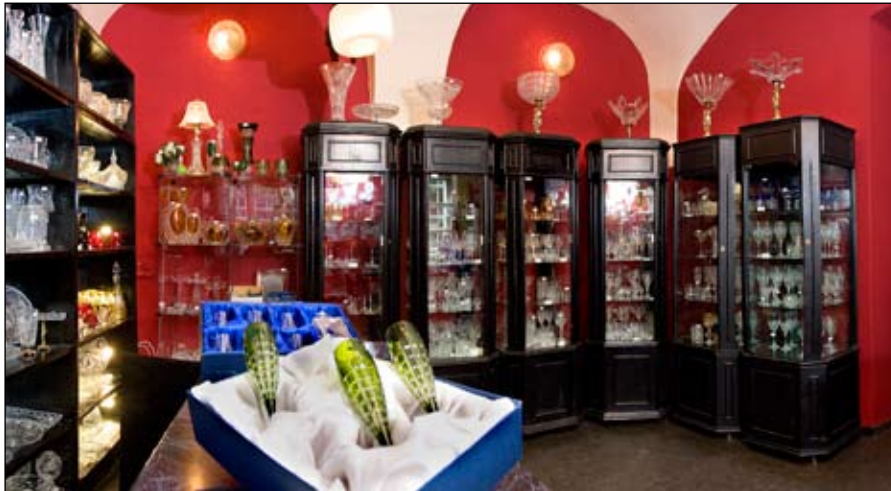
Sklep firmowy Julii ma teraz większą powierzchnię i bogatą ofertę

Huta z roku na rok ma się coraz lepiej. Eksportuje swoje wyroby do kilkunastu krajów na całym świecie. Piękne kieliszki, wazy, owocarki, karafki czy talerze trafiają głównie do Francji i krajów arabskich. Sporo zamawiają Zjednoczone Emiraty Arabskie, Arabia Saudyjska czy Maroko. Największe uznanie produkty kryształowe zdobywają w krajach wysokiej kultury stołu. W Polsce zostaje jedynie ok. 15 procent produkcji. Dziś Julia zatrudnia prawie 100 osób i produkuje kryształy według najlepszych wzorców sprzed lat.