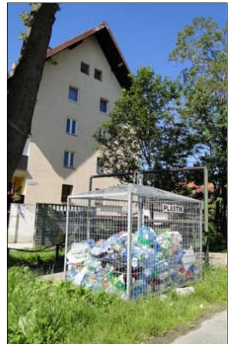
Segregacja jest ważna dla środowiska

Na terenie Gminy Piechowice najprędzej przepełniane są gniazda znajdujące się w centralnych punktach większych skupisk mieszkalnych. W związku z tym, jeżeli istnieje taka możliwość zachęcam Państwa do korzystania także z sąsiednich punktów zbiórki odpadów, które niejednokrotnie nie są w pełni zapełniane. Zwracam się również z prośbą, aby nie podrzucać odpadów innych niż poddawane selektywnej zbiórce, które należy zagospodarowywać na terenie własnych posesji poprzez składowanie w pojemnikach