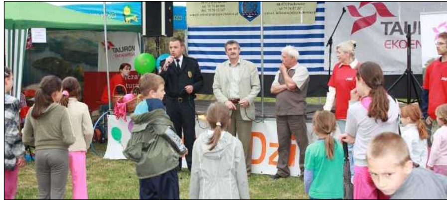
Z okazji Dnia Dziecka przygotowano festyn dla najmłodszych