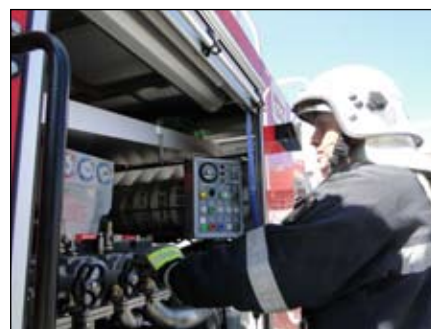
W Jakuszycach przetestowano nowy sprzęt