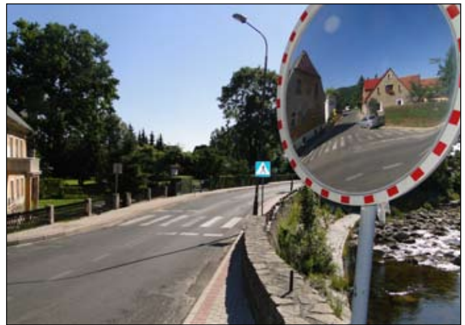
... a zakończy przy wyjeździe w stronę Sobieszowa.