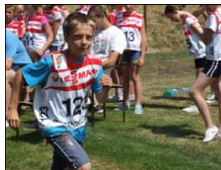
Memoriał cieszył się zainteresowaniem

Dziękuję wszystkim sędziom za pomoc i profesjonalne przeprowadzenie zawodów,