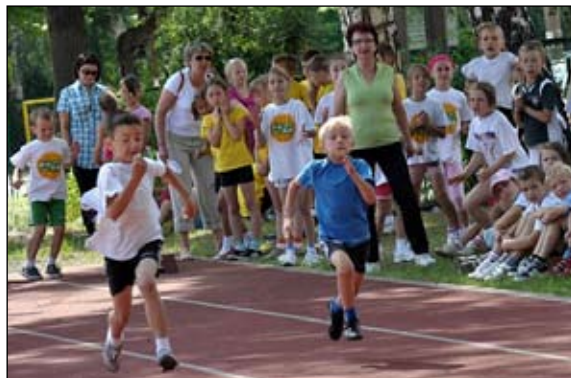
Zawodnicy z piechowickich szkół zajmują dobre lokaty