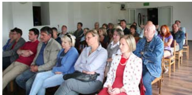
Największa frekwencja była w Michałowicach

Mając na uwadze fakt, że Rady Osiedli są najniższym szczeblem administracji samorządowej w mieście, stanowiącym najlepszy przekaznik informacji pomiędzy mieszkańcami a władzami miasta, warto