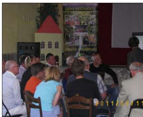
W debacie wzięło udział ponad 50 osób związanych z życiem społecznym miasta

z o.o. Tematem przewodnim dyskusji były „Kierunki Rozwoju Gminy Piechowice” w związku z aktualizacją Gminnej Strategii Rozwoju, przede wszystkim w dziedzinie sportu, turystyki, kultury i rekreacji.