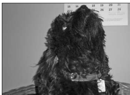
Piesek FIGA, który w roku 2010 otrzymał numer ewidencyjny 001