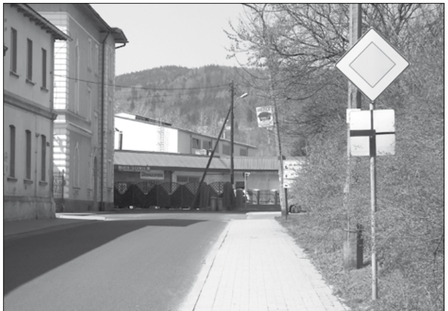
Koszt ustawienia jednego znaku drogowego to kwota ok. 300 zł.