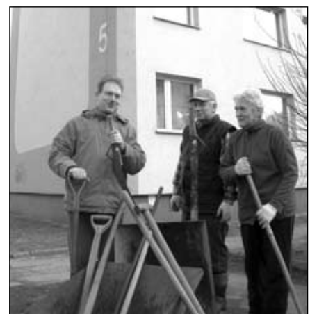
Mieszkańcy ulicy Szkolnej 5 sami wzięli za wiosenne porządki

Jednak nie oszukujmy się. Bez udziału MIESZKAŃCÓW żadna służba komunalna nie jest w stanie utrzymać porządku w tak rozległym mieście jak Piechowice. Dlatego dziękujemy tym, którzy chwycili za miotły, grabie i taczki i posprząkali już swoje otoczenie, swoje Miasto! Przykładów takich działań jest wiele. Jeden można zobaczyć na zdjęciu. Wspólnota z ulicy Szkolnej 5 już 23 marca wyległa przed blok i gruntownie