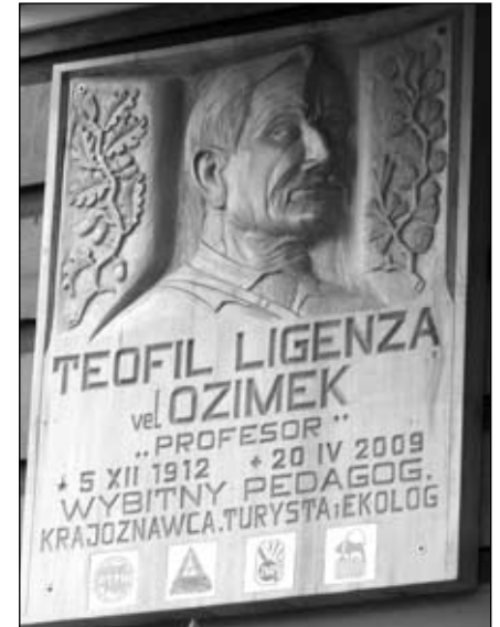
Tablica została odsłonięta w Michałowicach.