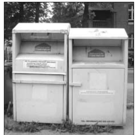
Wszystkie takie kontenery na odzież zostały usunięte z ulic miasta.