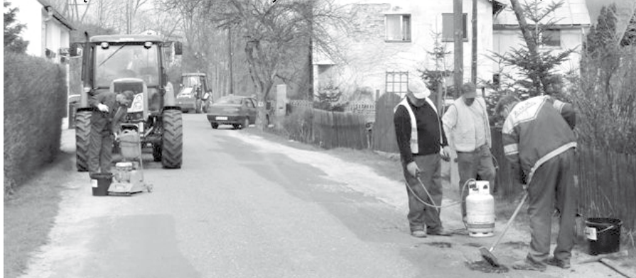
Drogi będą sukcesywnie naprawiane