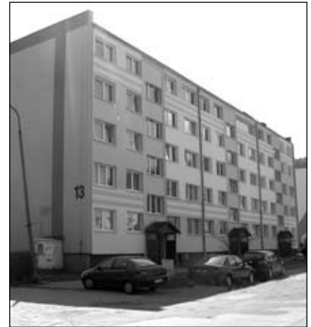
W Piechowicach jest ponad setka wspólnot mieszkaniowych

Na corocznych zebraniach właściciele zarządca składa sprawozdanie z prowadzonej działalności, rozlicza się z każdej wykonanej pracy, każdego opróżnionego kosza na śmieci czy wymienionej klamki. Wspólnota zatwierdza sprawoz-