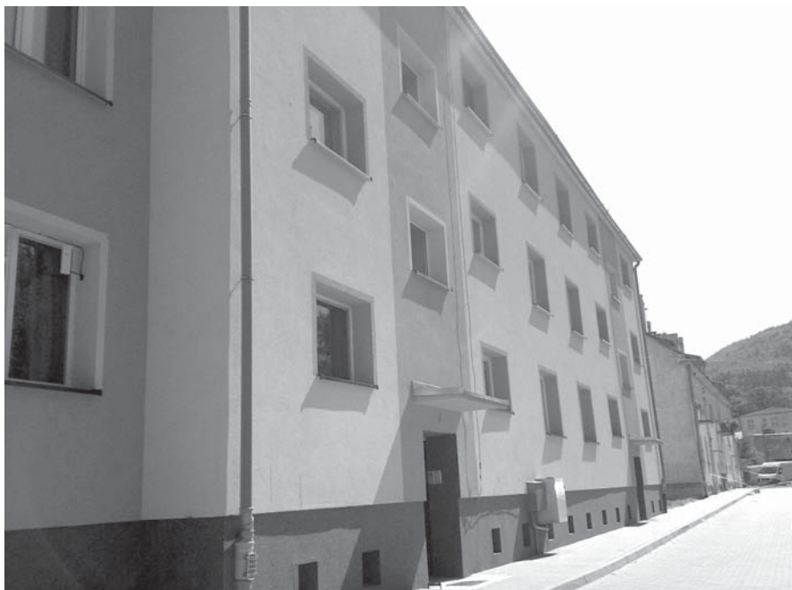
Wspólnota mieszkaniowa przy ul. Kościuszki 6 odnowiła elewację swojego bloku

Pamiętna wichura dała się we znaki kilku innym budynkom w Piechowicach. W dalszym ciągu zgłaszane są roszczenia o odszkodowanie z budynku przy ul. Żymierskiego 56, gdzie wiatr wyrwał część dachu. Wspólny Dom wystąpi do ubezpieczyciela o pokrycie tych strat.