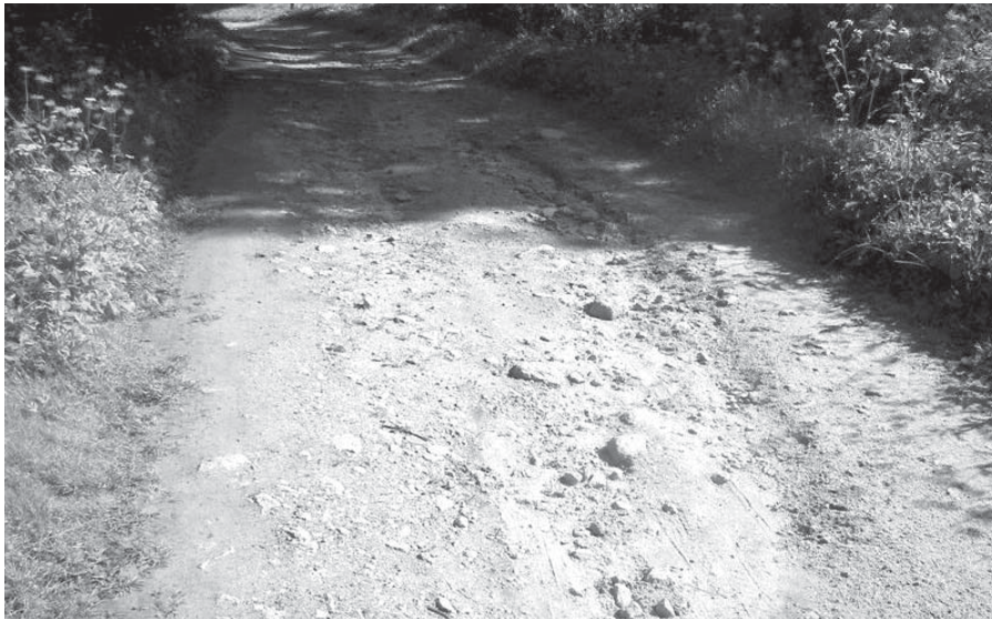
Czerwcowe deszcze spowodowały szereg wymięć w drogach na terenie Piechowic

Miasto zdobyło dodatkowe środki, dzięki którym przeprowadzone będą częściowe remonty najbardziej zniszczonych fragmentów dróg. Najważniejsze będzie to, aby wybudować odwodnienia, o których do tej pory nikt nie myślał naprawiając drogi w Michałowicach.