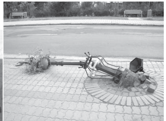
Koszt naprawy tej latarni pokryje firma ubezpieczeniowa