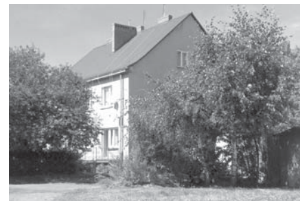
Blok przy ul. Kościuszki 7 zyskał nowy dach