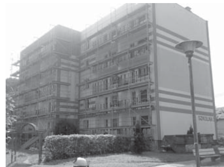
Bloki przy ul. Szkolnej zostały odmalowane