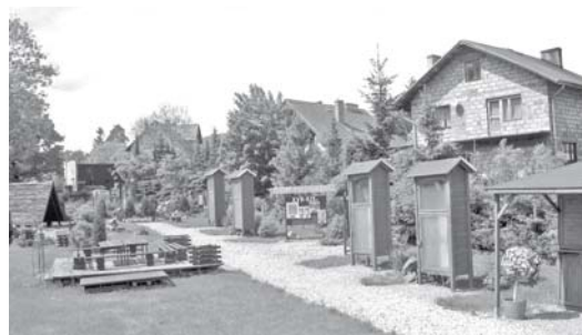
Fragment ekspozycji „szklanego ogrodu”, który będzie służył edukacji najmłodszych

wickiego Ośrodka Kultury uznając, że „szklany ogród” jest ekspozycją zbyt skromną, aby stanowić atrakcję turystyczną miasta. Jednak doskonale służyć będzie jako zielona sala edukacyjna najmłodszym nie tylko z Piechowic. Dlatego też teren szklanego ogrodu powrócił w użytkowanie PS nr 1.