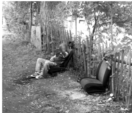
Gdy nie ma ławeczek, można sobie poradzić w ten sposób