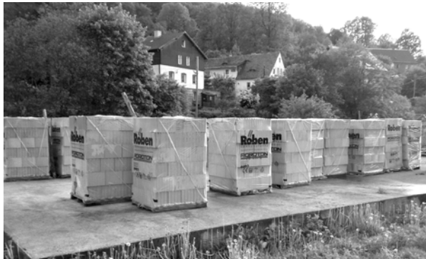
Prace przy budowie rozpoczął jeleniogórski biznesmen, nowy właściciel dwóch kamienic.

Mało tego, to chciałby rozbudować obiekt. Do urzędu miasta wpłynęło pismo o wydzierżawienie lub sprzedaż części terenu znajdującego się obok dwóch już zakupionych działek. Na razie Komisja Budżetu i Zagospodarowania Przestrzennego Miasta zaopiniowała wniosek pozytywnie. Teraz jeszcze na rozbudowę o kolejne działki musi się zgodzić rada miejska.