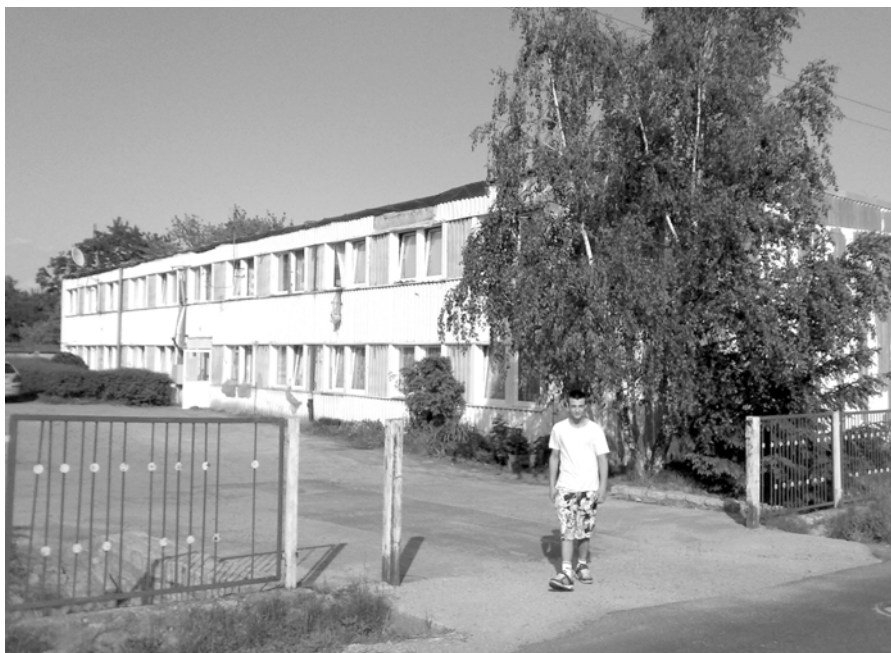
Mieszkańcy bloku w Górzyniu przeżyli chwile grozy.

Uchwała nr 246/XLI/09 z dnia 21 maja 2009 r. w sprawie odwołania delegata do Zgromadzenia Związku Gmin Karkonoskich oraz uchwała nr 247/XLI/09 z dnia 21 maja 2009 r. w sprawie wyboru delegata do Zgromadzenia Związku Gmin Karkonoskich.