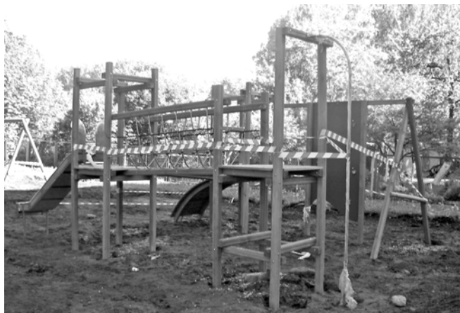
Prace na placu zabaw, który będzie czynny od 1 czerwca

wie są atestowane, estetyczne i mejmy nadzieję, że służyć będą dzieciom przez długi okres czasu. Montowała je przez trzy dni firma Interflora z Wrocławia. Plac będzie ogrodzony, monitorowany, brama - zamykana na noc. Pieczę nad placem sprawować będzie ZUK, obiekt będzie patrolowany przez firmę ochroniarską. Prowadzi do niego nowa alejka. Całkowity koszt urządzenia tego miejsca (bez wspomnianej alejki) to około 50 tys. zł. Czy można by te pieniądze wydać na coś innego? Na pewno, ale Piechowice to bodaj jedyna miejscowość w powiecie pozbawiona ładnie