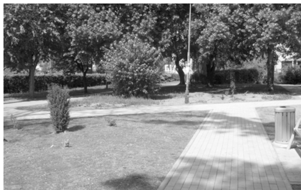
Uporządkowany skwerek podoba się mieszkańcom.

A gdyby nie sprzedawać w okolicznych sklepach tanich napojów alkoholowych, może powód przesiadywania amatorów „mamrotów” na ławeczkach w ich pobliżu nie miałby podstaw?