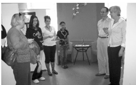
W czasie wernisażu

Wydarzenie uznać można za udane, oby w przyszłości podobnych było więcej.