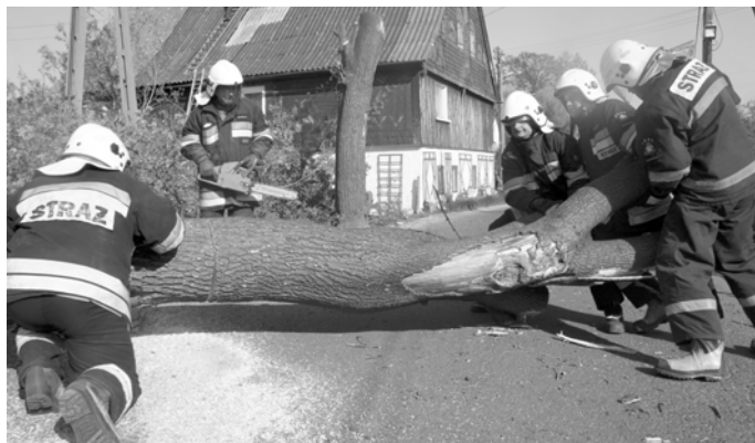
Strażacy-ochotnicy w pracy, w czasie usuwania zwalonego na drogę drzewa.