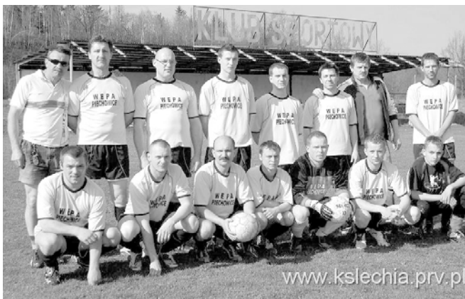
Drużyna Lechii Piechowice przed meczem z UKS 06 Sosnowka.