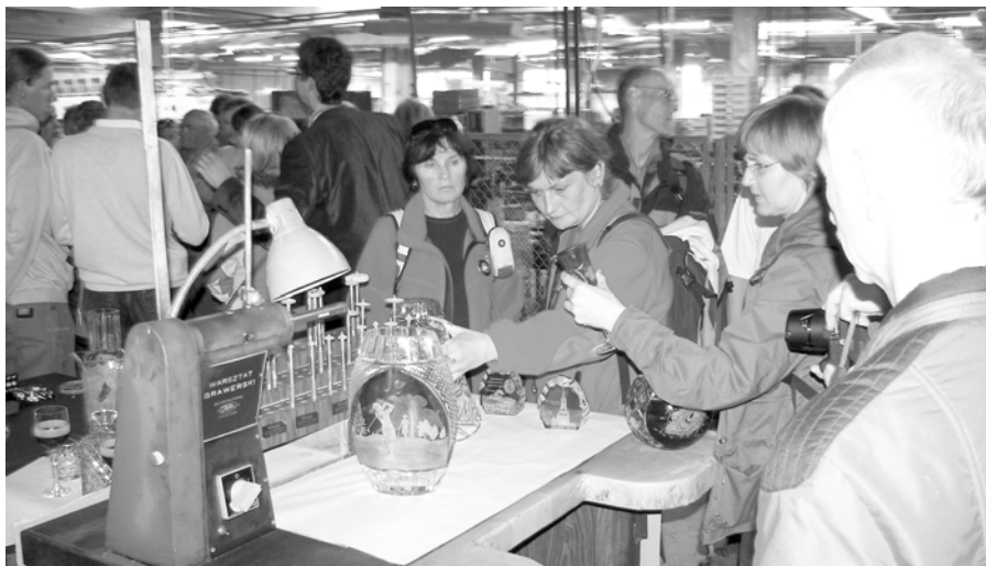
Przewodnicy zwiedzili m.in. hutę szkła „Julia”.