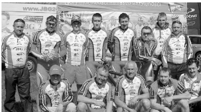
Drużyna Lechii podczas startu w maratonie we Wrocławiu.