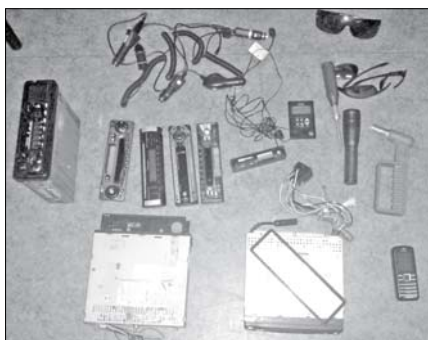
Po odbiór odzyskanych łupów można się zgłaszać na policję do komisariatu w Cieplicach.

22 kwietnia policjanci z Komisariatu II Policji w Jeleniej Górze ustalili i zatrzymali 15-letniego jeleniogórzanina i 19-letniego mieszkańca Piechowic. Zatrzymani okradli kilkanaście samochodów w nocy z 20 na 21 kwietnia w Piechowicach. Jak ustalili policjanci mają na swoim koncie również kradzież z włamaniem do sklepu i budynku. Ich łupem z samochodów padały przypadkowe przedmioty, tj. telefony komórkowe, okulary przeciwsłoneczne, radia. Ze sklepu sprawcy ukradli dwie butelki napojów o wartości 10 zł, a z budynku dwa rowery. Łączne straty pokrzywdzonych wynoszą kilkanaście tysięcy złotych. Większość skradzionych fantów policjanci odnaleźli w piwnicy 19-latka. Funkcjonariusze zabezpieczyli również „młoteczki” wykorzystywa-