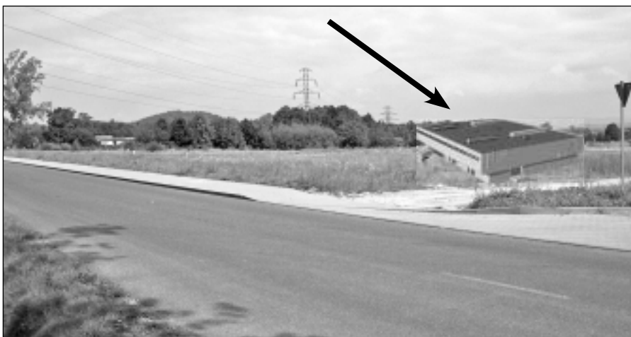
Nowy zakład powstanie w trójkącie pomiędzy Ceramiką Marconi, stacją Müller i cmentarza. Na zdj. zaznaczono tylko lokalizację obiektu (w rzeczywistości będzie on wyglądał inaczej).