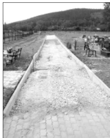
Cmentarz w Piechowicach będzie miał wkrótce dwie nowe alejki

• Trwać będzie do połowy listopada budowa kanalizacji sanitarnej od studzienki w ul. Kolejowej do projektowanej studzienki na ul. Zawadzkiego na wysokości budynków 2a i 3 z