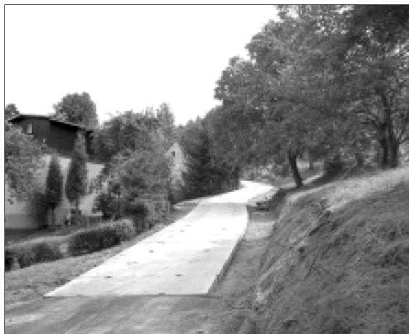
Ulica Wczasowa wkrótce będzie jak nowa.

• Kończy się przebudowa ul. Wczasowej, która miała zniszczoną nawierzchnię asfaltową, wymyła podbudowę tłuczniovą i zniszczone urządzenia odwadniające. Wykonywana jest nawierzchnia z płyt żelbetowych ze stykami zaspoinowanymi zaprawą cementowo-piaskową. Termin