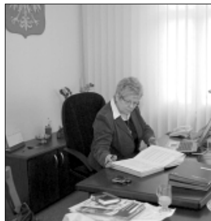
Burmistrz przegląda poranną pocztę

Z pewnością będą spore utrudnienia z tego powodu, ale mam nadzieję, że zniesiecie je Państwo z wyrozumiałością. Mam też nadzieję, że podoba się Państwu odnowiony skwerek przy Kościele Parafialnym, a nowe ławeczki na przystanku MZK dobrze służyć będą oczekującym na autobusy. A przy okazji dziękuję tym wszystkim,