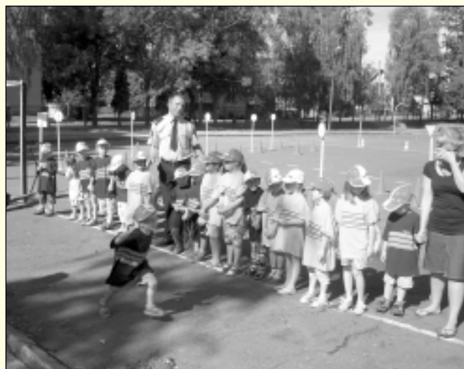
Dzieci przedszkolne miały w czasie wakacji dużo frajdy.

Przypominamy, że nasze przedszkole czynne jest od godziny 6:00 do 16:00.