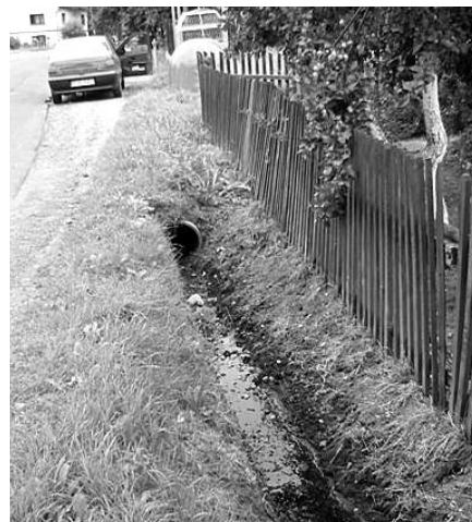
Nieczystości często trafiają do przydrożnych rowów. Na zdj. fragment ul. Pakoszowskiej

W roku 2008 wybudowano w Piechowicach 1,6 km sieci kanalizacyjnej i 0,5 km sieci wodociągowej ze środków własnych miasta i z dotacji z WFOŚiGW (ul.1 Maja i odcinek Zawadzkiego-prace zakończono oraz ul. Norwida-prace trwają). Koszt tych dwu zadań to około 1,6 mln zł.