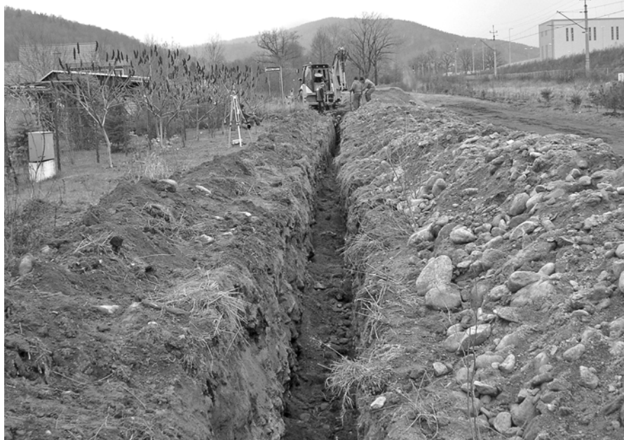
Na zdj. inwestycja w trakcie. Dziś teren wygląda już inaczej.

Po zrealizowaniu inwestycji 7 posesji przy ul. Norwida zostanie uzbrojonych w wodociąg i sieć kanalizacji sanitarnej. Z pewnością ułatwi to mieszkańcom codzienne życie.