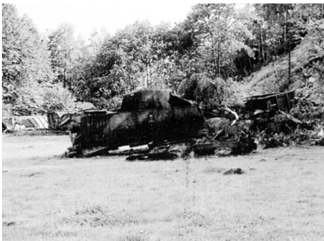
Do wypadku kolejowego w okolicach Górzynca doszło we wrześniu 1980 roku. Zginęły dwie osoby. Ruch był zablokowany przez dwa dni.

Obie stacje dzieliło tylko 2,5 km. W „Górnej” natychmiast wstrzymano manewry, ustawiono zwrotnice, nie zdążono nawet podać semafora, gdy po chwili po torze głównym dodatkowym (nr 3) z prędkością 60–70 km przemknęła masa ponad tysiąca ton, kierując się ku położonym 300 m niżej Piechowicom. Czy myślano o wykolejeniu składu już na początku jego szaleńczej drogi? Zapewne tak, choć czasu do zastanowienia nie było wcale więcej, niż zajmuje przeczytanie opisu tych pierwszych dramatycznych chwil. Wszyscy mieli jednak w pamięci poprzedni wypadek z ok. 1976–77 roku, gdy w Jakuszyce zbiegły cztery próżne węglarki i brankard z kierownikiem pociągu. Rozpędzone wagony próbowano w Szklarskiej „złapać” na uciekający parowóz, który akurat manewrował po przyprowadzeniu pociągu z Warszawy. Położone płozы prysnęły spod kół jak pociski, brankard w wyniku uderzenia o „tekatkę” rozsywał się w drzazgi. Z rumowiska cudem wydostał się poturbowany tylko kierownik. Tym razem wykolejenie na ograniczonej pionową skalną ścianą stacji, na której stał skład osobowy było zbyt ryzykowne, a szanse na ujęcie z życiem drużyny parowozowej – niewielkie.