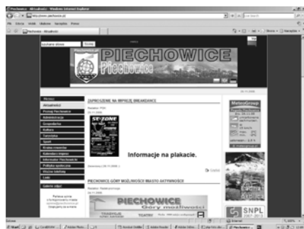
Strona internetowa miasta została dobrze oceniona.

nie dokonano aktualizacji bazy noclegowej – obiekty z naszej gminy mają wreszcie przyporządkowane do danych teleadresowych zdjęcie przedstawiające obiekt. Dodatkowo są linki odsyłające do stron internetowych bezpośrednio do obiektu, gdzie turysta może sprawdzić ceny miejsc noclegowych czy zapoznać się ze szczegółową ofertą gestora. Istnieją również aktywne linki kontaktowe bezpośrednio ze strony www.piechowice.pl . Taka baza danych obiektów noclegowych z gminy Piechowice w jednym miejscu umożliwia turystyce wybór najbardziej odpowiadającej mu oferty i skupia w jednym miejscu rozproszoną dotychczas informację.