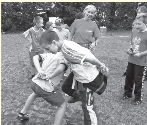
Piechowskie dzieci miały frajdę wspólnie się bawiąc.

Ostatni weekend lipca br. to jednocześnie ostatni dzień zajęć wakacyjnych organizowanych dla dzieci w Piechowskim Ośrodku Kultury.