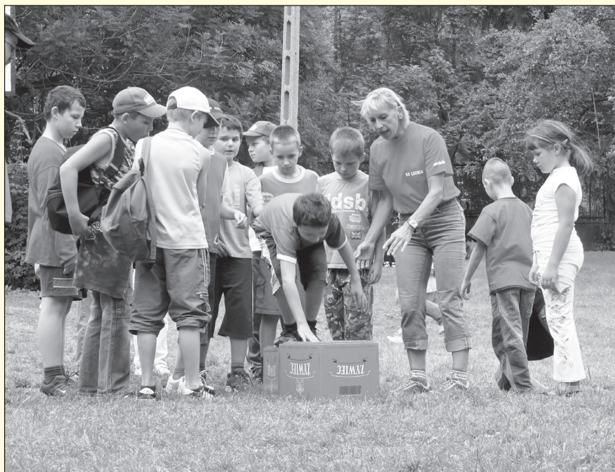
Tegoroczna impreza „Pod chmurką” udała się znakomicie.