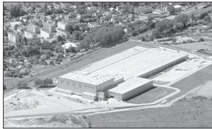
Obok Ceramiki Marconi ma powstać nowy zakład. Procedury trwają.