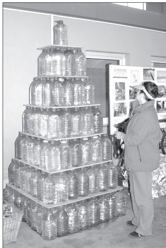
Wbrew pozorom metr szczęśliwy wody to bardzo dużo. Zmieści się we wszystkich butelkach widocznych na zdjęciu.

Wskazać należy również, że mimo zmiany taryfy za wodę i ścieki, ceny obowiązujące w naszym mieście nie są na najwyższym poziomie. I tak dla przykładu ceny z innych miast i gmin: