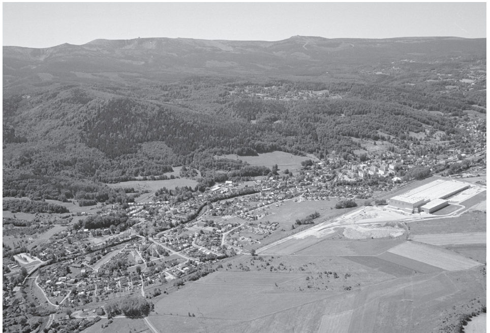
W Piechowicach w ewidencji działalności gospodarczej jest zarejestrowanych ponad 600 podmiotów.