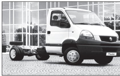
Już wkrótce podobny pojazd pojawi się w Piechowicach i będzie służył mieszkańcom.

W czerwcu został ogłoszony przetarg na zakup samochodu osobowo-dostawczego, po przeanalizowaniu ofert, wybrano najkorzystniejszą. W ciągu dwóch miesięcy (okres realizacji) zostaniemy posiadaczami no-