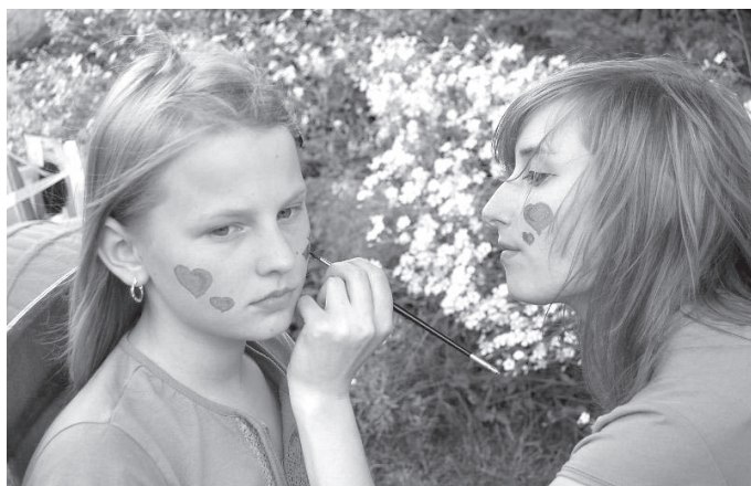
Uczestnicy pikniku dobrze się bawili.

Organizatorzy chcieli również zaproponować alternatywne formy spędzania wolnego czasu integrujące rodziny i rozwijające zainteresowania sportowe i turystyczne, co stanowi skuteczną przeciwwagę dla używania substancji psychoaktywnych.