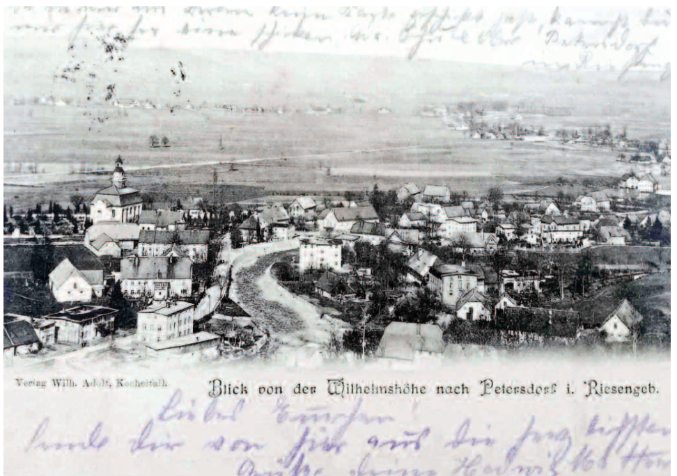
Widok z Uroczyska na Piechowice z roku 1901