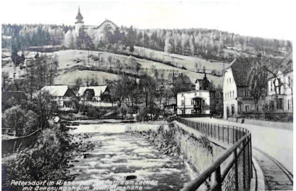
Partie nad Kamienną widoczny jaz i urząd około 1935